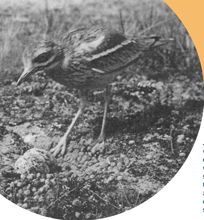
Griel bij nest, mei 1932, Vogelenzang, Amsterdamse Waterleidingduinen.

Om het voorkomen te beschrijven zijn de databases gecombineerd van het Bijzondere Soorten Project niet-broedvogels (BSP; 1989-2018), Waarneming.nl (1835-2018), CDNA (Commissie Dwaalgasten Nederlandse Avifauna, dutchavifauna.nl; 1969-2008) en Vogeltrekatlas.nl (1950-2018). De in totaal 2294 waarnemingen werden na controle op dubbele en vervolgwaarnemingen teruggebracht tot 178 gevallen (223 vogels). Hieronder schetsen we een beeld van het voorkomen, voornamelijk sinds 1969, het eerste jaar dat de soort door de CDNA beoordeeld werd (148 gevallen en 150 vogels). De database is vast incompleet, ook omdat sommige waarnemingen geheimgehouden zijn, maar zal een goede afspiegeling geven van het optreden in Nederland de afgelopen halve eeuw.