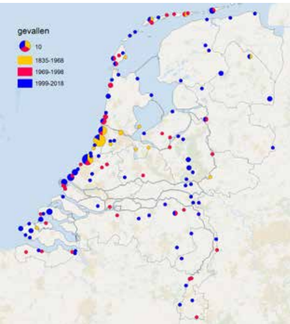
Figuur 2. Griel. Verspreiding in 1835-2018 waarbij onderscheid is gemaakt in drie perioden: 1835-68 (database zeer onvolledig), 1969-98 (start beoordeling door CDNA in 1969, start BSP in 1989) en 1999-2018.