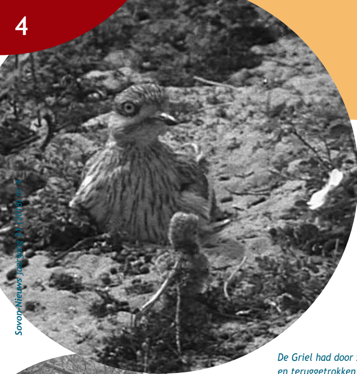
Griel met pullus bij nest, mei/juni 1950, Verbrande Pan, Bergen (still uit film). Jan P. Strijbos