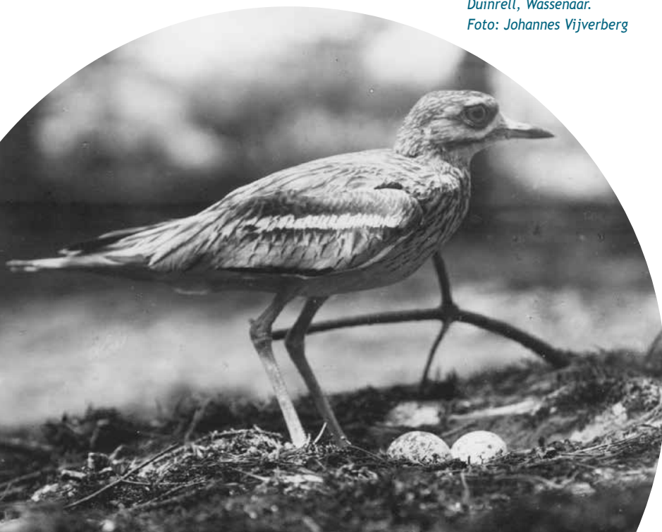
Griel bij nest, 12 juli 1924. Duinrell, Wassenaar.

De Griel had door zijn zeldzaamheid en teruggetrokken gedrag een onweerstaanbare aantrekkingskracht op de vooroorlogse Nederlandse vogelfotografen. Noodgedwongen - camera's waren log, zwaar en traag - moesten ze zich richten op nestfotografie. Dat gebeurde met ingenieuze trucs (een loopdraad bij het nest, verbonden met de camera zodat de vogel 'zichzelf fotografeerde') of vanuit schuilhutten. Men leze hierover in het hoofdstuk 'Vogelfotografie en -bescherming: van de pioniers tot de activisten' (auteur Ruud Vlek) in het boek 'Een eeuw vogels beschermen van Frank Saris (pag. 189-195)'. Hierbij een collage van historische foto's, waarbij die van Strijbos een van de laatste Nederlandse nestfoto's van een Griel met jong zal zijn geweest. Met dank aan Ruud Vlek voor het bezorgen van dit unieke materiaal.