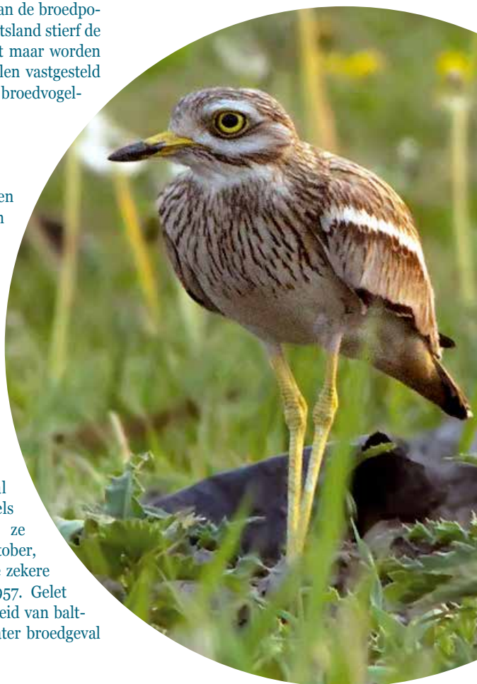
Griel, Oudeland van Strijen ZH, 24 april 2011.

geringde volwassen vogel werd op 10 mei 1995 dood gevonden bij Wijk aan Zee NH, een op 11 juli 2011 geringde pul op 11 mei 2012 bij Pieterburen Gr. De kleurring van een nestjong (9 juni 1993) werd op 5-7 juni 1994 afgelezen bij Wilp Gl en een andere als pul gekleurde Griel (10 juni 2009) dook een klein jaar later op bij Beugen