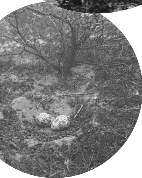
Griel, tweelegsel, 12 mei 1915, Kennemerduinen, Bloemendaal.

De Griel had door zijn zeldzaamheid en teruggetrokken gedrag een onweerstaanbare aantrekkingskracht op de vooroorlogse Nederlandse vogelfotografen. Noodgedwongen - camera's waren log, zwaar en traag - moesten ze zich richten op nestfotografie. Dat gebeurde met ingenieuze trucs (een loopdraad bij het nest, verbonden met de camera zodat de vogel 'zichzelf fotografeerde') of vanuit schuilhutten. Men leze hierover in het hoofdstuk 'Vogelfotografie en -bescherming: van de pioniers tot de activisten' (auteur Ruud Vlek) in het boek 'Een eeuw vogels beschermen van Frank Saris (pag. 189-195)'. Hierbij een collage van historische foto's, waarbij die van Strijbos een van de laatste Nederlandse nestfoto's van een Griel met jong zal zijn geweest. Met dank aan Ruud Vlek voor het bezorgen van dit unieke materiaal.