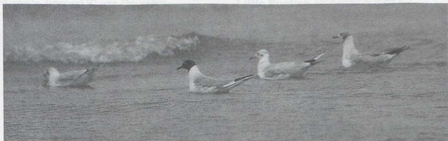
38 Bonaparte's Gull Larus philadelphia , IJmuiden, Noordholland, August 1985

ped and photographed (J A de Vries, W Bil, A de Vries; de Vries 1987).