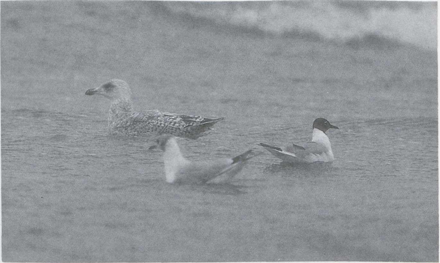
44 Kleine Kokmeeuw Larus philadelphia , Kokmeeuw L. ridibundus en Zilvermeeuw L. argentatus , IJmuiden, Noordholland, augustus 1985 (Ger Blok)

Blotzheim & Bauer 1982, Cramp & Simmons 1983). De handpenruï begint bij de binnenste pen (Cramp & Simmons). Verder was in het veld en vooral op foto's een begin van ruï te zien op de oorstreek. Als vroegste datum voor ruï van kopveren wordt 5 augustus vermeld (Beardslee 1944). Bij de Kokmeeuw begint de kopruï midden juli (Glutz von Blotzheim & Bauer). De aanwezige Kokmeeuwen waren inderdaad al verder in ruï, hetgeen te zien was aan de vergevorderde kop- en slagpenruï.