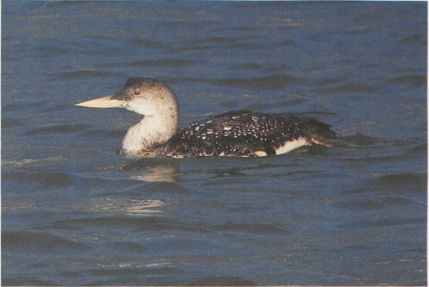
34 Yellow-billed Diver Gavia adamsii , Scheveningen, Zuidholland, December 1984 (René Pop) 35 Steppe Eagle Aquila rapax , Someren, Noordbrabant, February 1984 (René Pop) 36 Collared Flycatcher Ficedula albicollis , Maasvlakte, Zuidholland, May 1985 (René van Rossum)