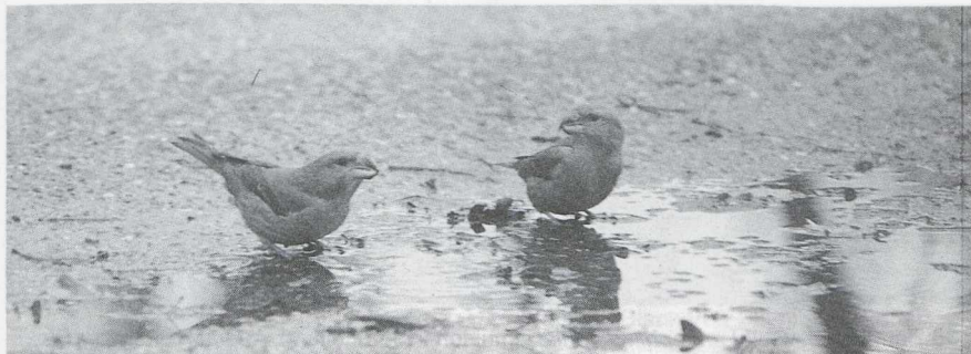
40 Parrot Crossbills Loxia pytyopsittacus , Castricum, Noordholland, January 1983 (Henk-Jan Udding)

1982 NOORDHOLLAND Bloemendaal, 16 September to 3 March 1983, 20 at most, photographed and sound recorded (Blankert & Steinhaus 1983, Schekkerman 1986). Texel, 24 October to 13 March 1983, 50 at most, photographed and sound recorded (Hazevoet 1983, Schekkerman 1986). Aerdenhout, 1 November to 11 February 1983, 33 at most, photographed and sound recorded (Blankert & Steinhaus 1982-83, Schekkerman 1986, Chappuis 1987). Egmond, 3-4 November, male and two females (N F van der Ham, J van der Laan, J L Apperloo). Schoorl, 6 November to 16 March 1983, 40 at most (Schekkerman 1986). Castricum, 13 November to 16 April 1983, 35 at most, photographed (Schekkerman 1986).