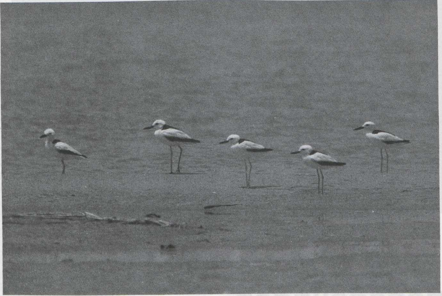
48-49 Crab Plovers Dromas ardeola , Turkey, July 1986