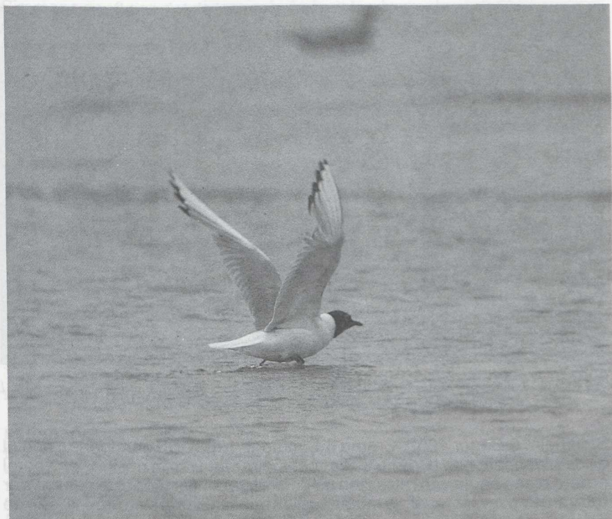
43 Kleine Kokmeeuw Larus philadelphia , IJmuiden, Noordholland, augustus 1985