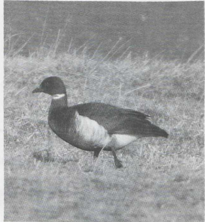
59 Zwartbuikrotgans Branta bernicla nigricans , Flauwers Inlagen, Zeeland, februari 1987 (Arie de Knijff)

STEPPEHOENDERS TOT GORZEN Op 4 maart was er een claim van twee Steppehoenders Syrnhaptes paradoxus bij de Braakman Z die helaas niet nader bevestigd kon worden. Tot midden januari deed een Tortel Streptopelia turtur een poging tot overwinteren bij Westenschouwen Z. In de Boswachterij Grollo D werden in maart twee Ruigpootuilen Aegolius funereus gehoord. Bepaald vroeg was een Gierzwaluw Apus apus die op 27 maart op de Maasvlakte dood gevonden werd. Tot in februari waren er op veel plaatsen — vooral in het binnenland — nog groepen Strandleeuweriken Eremophila alpestris present. Zo waren er vele 10-tallen in de Eemshaven, langs de randmeren van de Flevo en langs de Ooster- en Westerschelde. Er was een troep van c 200 bij Eibergen Gld. Vele 100-en — zo niet 1000-en — zouden er in Noordbrabant hebben gezeten. In België waren er groepen