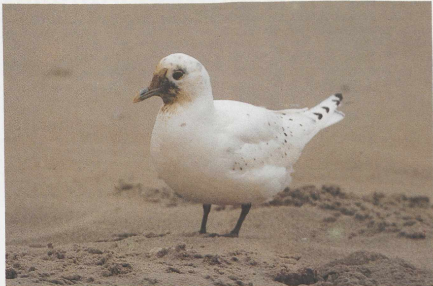
45 Ivoormeeuw Pagophila eburnea , Schiermonnikoog, Friesland, februari 1987

steeds van aangespoelde vogels en had daardoor vuil en vettigheid rond de snavelbasis. De vogel zag er verder gaaf uit en leek in goede conditie. Gezien het ruime voedselaanbod in de vorm van dode vogels viel te verwachten dat de Ivoormeeuw nog wel enige tijd op het eiland zou blijven. Het was dan ook opmerkelijk dat de meeuw de volgende dag niet meer kon worden teruggevonden en nadien ook door niemand meer werd gemeld.