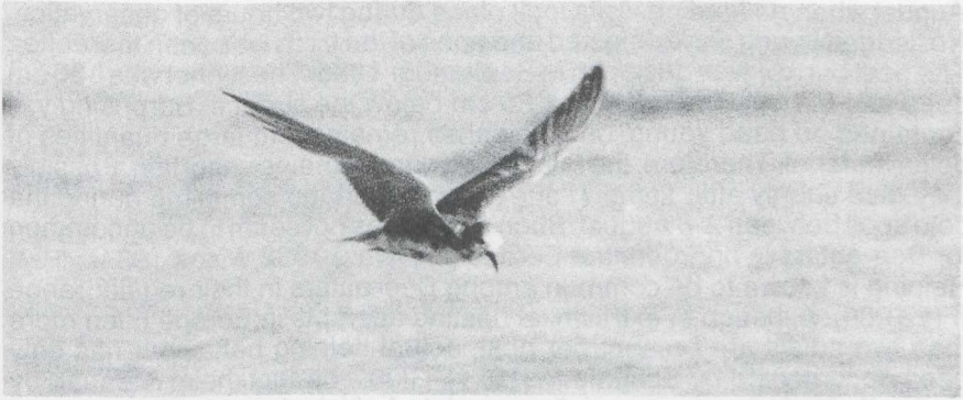
50 Black Tern Chlidonias niger , French Guiana, September 1986 (Olivier Tostain)

Blake, E R 1977. Manual of Neotropical birds 1. Chicago.