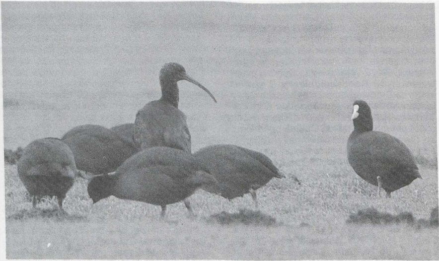
54 Zwarte Ibis Plegadis falcinellus en Meerkoeten Fulica atra , Camperduin, Noordholland, januari 1987

half januari werden er weer vele 10-tallen Witbuikrotganzen B bernicla hrota gezien, voornamelijk rond de Grevelingen Z met groepen tot 50 exemplaren. Zwartbuikrotganzen B b nigricans werden gezien bij Westkapelle van 17 tot 20 januari, bij de Flaauwers Inlagen Z op 7 februari en bij Wolphaartsdijk Z op 5 en 6 maart. Bij Zandvliet A zaten op 4 januari nog steeds twee Roodhalsganzen B ruficollis . Bij Spijkenisse zaten er twee van 3 tot 31 januari. Enkelingen waren er te Meetkerke van 3 tot 7 januari, te Vlissegem Wvl op 10 januari en bij Damme op 15 januari. Op 29 maart zat er een mannetje Amerikaanse Smient Anas americana bij het Jaap Deensgat in de Lauwersmeer Gr. Witog-eenden Aythya nyroca werden gemeld bij Brugge Wvl van 24 december tot 19 januari, bij Meer A op 8 januari, op het Amstelmeer Nh op 11 januari (twee), in de Dintelhaven Zh op 31 januari, bij Galder Nb op 22 februari, in De Kennemerduinen Nh op 14 maart en bij Eke van 16 tot 18 maart. De determinatie van een vrouwtje Koningseider Somateria spectabilis dat op 20 januari te IJmuiden Nh gefotografeerd werd leidde niet tot een eensluidend oordeel. Veel vogelaars zullen