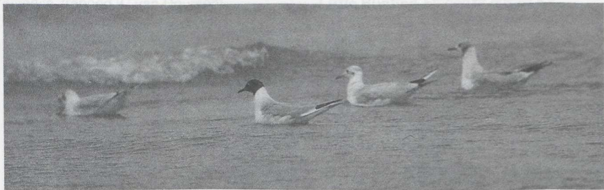
38 Bonaparte's Gull Larus philadelphia , IJmuiden, Noordholland, August 1985

ped and photographed (J A de Vries, W Bil, A de Vries; de Vries 1987).