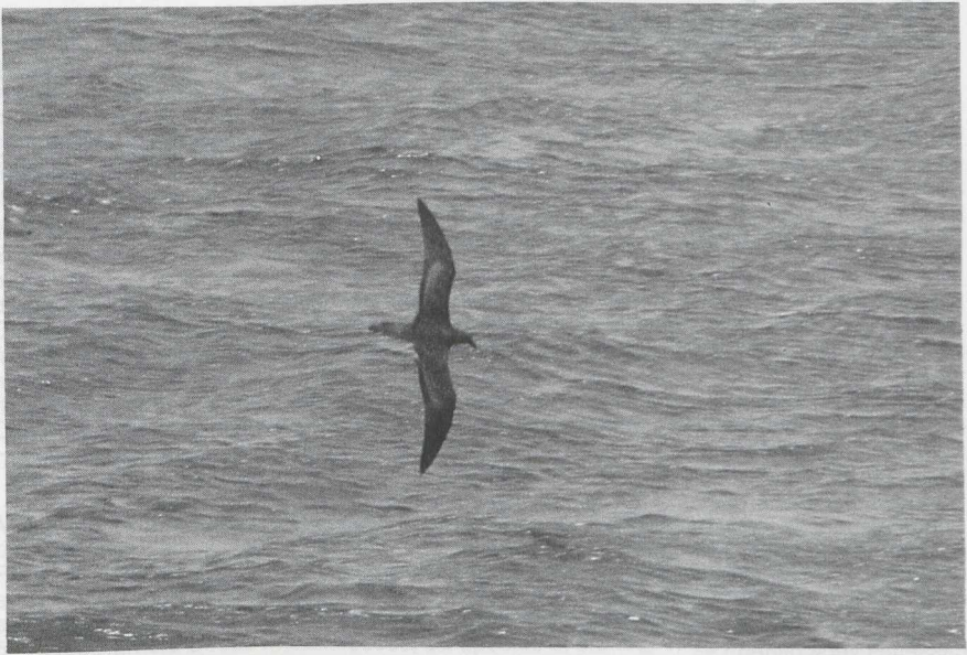
51-52 Jouanin's Petrel Bulweria fallax , Arabian Sea, July 1985