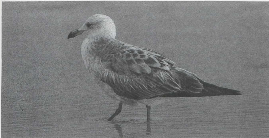
Mystery photograph 24. Solution in next issue.