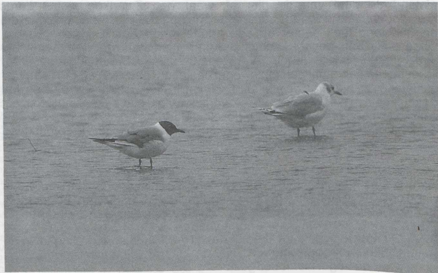
42 Kleine Kokmeeuw Larus philadelphia , IJmuiden, Noordholland, augustus 1985

GEDRAG Op zee zwemmend, rustend en af en toe pikkend in drijvend wier. Soms laag boven wateroppervlak rondvliegend. Vlucht midden houdend tussen Dwerg- en Kokmeeuw. Eenmaal op drijvende plank staand. Op strand veel rustend en poetsend. Af en toe voedsel zoekend bij waterlijn door middel van voedseltrappelen of pikken in aanspoelsel. Niet speciaal met enige meeuwesoorsoort geassocieerd.