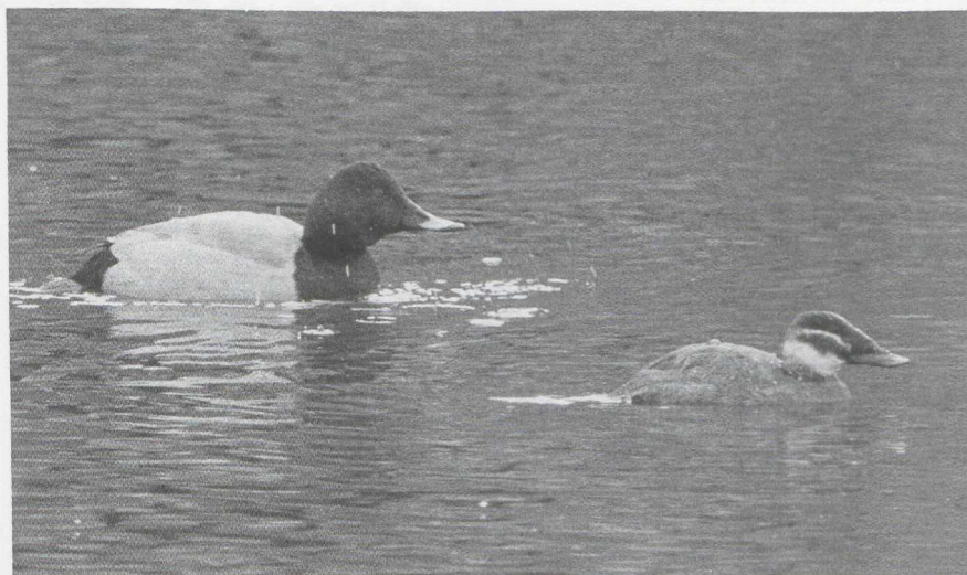
55 Witkopeend Oxyura leucocephala en Tafeleend Aythya ferina , Utrecht, Utrecht, februari 1987 (Hans Gebuis)

eerder: behalve een overwinteringsgeval in het Verdronken Land van Saeftinge Z kwamen al vanaf half januari de eerste meldingen binnen. Tot eind maart waren dit er minstens 14 in Nederland en België. De onvolwassen Zeearend Haliaeetus albicilla , die tussen Kalmthout A en het Verdronken Land van Saeftinge verbleef, werd daar nog tot 10 januari gezien. Verder was er op 4 januari een onvolwassen Zeearend bij het Ketelmeer FI, op 10 januari een adult in de achterhaven van Zeebrugge, begin januari een onvolwassen bij Gaast Fr, op 17 en 18 januari een onvolwassen bij Oud-Beets Fr en de gehele periode — in ieder geval tot 8 maart — zeker twee en wellicht drie in de Biesbosch Nb. De grootste kilometerreter van dit seizoen was wel de Giervalk Falco rusticolus die van 7 februari tot half maart regelmatig in en om de Eemshaven Gr werd gesignaleerd en daar ook in april weer enkele malen opdook. Bij Beegden L werd op 1 februari een Slechtvalk F peregrinus gezien met kenmerken van de ondersoort F p calidus . Gedurende de winter werden van veel plaatsen Slechtvalken gemeld. Bij Goedereede liet zich er een bij uitzondering eens van dichtbij fotograferen.