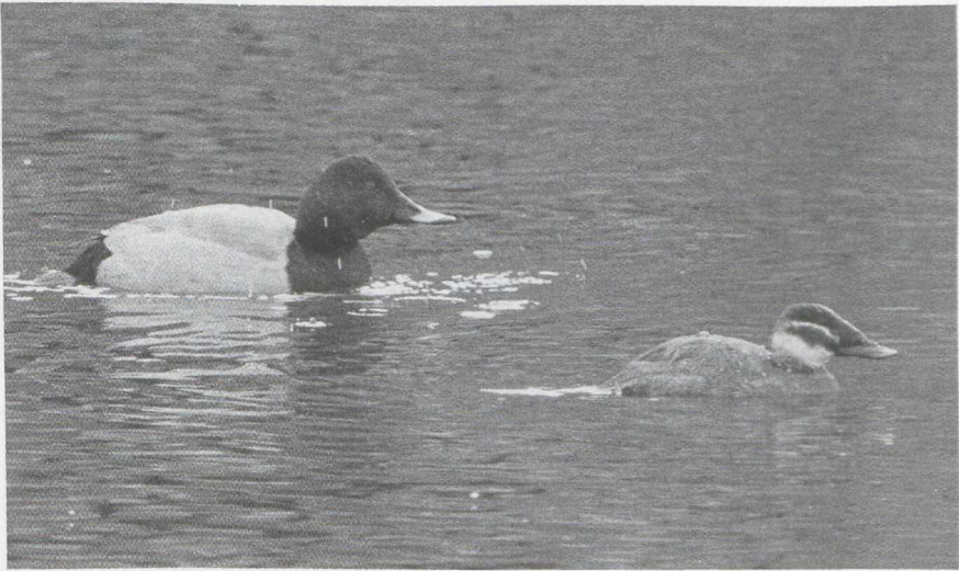
55 Witkopeend Oxyura leucocephala en Tafeleend Aythya ferina , Utrecht, Utrecht, februari 1987 (Hans Gebuis)

eerder: behalve een overwinteringsgeval in het Verdronken Land van Saeftinge Z kwamen al vanaf half januari de eerste meldingen binnen. Tot eind maart waren dit er minstens 14 in Nederland en België. De onvolwassen Zeearend Haliaeetus albicilla , die tussen Kalmthout A en het Verdronken Land van Saeftinge verbleef, werd daar nog tot 10 januari gezien. Verder was er op 4 januari een onvolwassen Zeearend bij het Ketelmeer FI, op 10 januari een adult in de achterhaven van Zeebrugge, begin januari een onvolwassen bij Gaast Fr, op 17 en 18 januari een onvolwassen bij Oud-Beets Fr en de gehele periode — in ieder geval tot 8 maart — zeker twee en wellicht drie in de Biesbosch Nb. De grootste kilometervreter van dit seizoen was wel de Giervalk Falco rusticolus die van 7 februari tot half maart regelmatig in en om de Eemshaven Gr werd gesignaleerd en daar ook in april weer enkele malen opdook. Bij Beegden L werd op 1 februari een Slechtvalk F peregrinus gezien met kenmerken van de ondersoort F p calidus . Gedurende de winter werden van veel plaatsen Slechtvalken gemeld. Bij Goedereede liet zich er een bij uitzondering eens van dichtbij fotograferen.