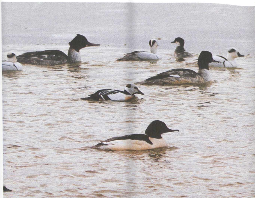
56 Stellers Eider Polysticta stelleri met Nonnetjes Mergus albellus en Grote Zaagbekken M merganser , Houtribsluizen, Flevoland, januari 1987 (C J Breek) 57 Giervalk Falco rusticolus , Eemshaven, Groningen, februari 1987 (C J Breek) 58 Slechtvalk F peregrinus , Goedereede, Zuidholland, februari 1987 (E H Ettema)