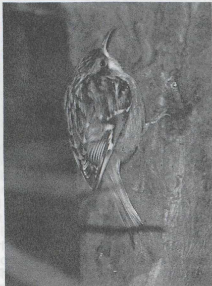
46 Tree creeper Certhia familiaris , Wieringerwerf, Noordholland, January 1987 47 Short-toed Tree creeper C brachydactyla , Alphen aan den Rijn, Zuidholland, February 1987

23 Mystery photograph 23 obviously shows a tree creeper Certhia . The two species occurring in the western Palearctic are difficult to separate, the more so from photographs, when their characteristic calls can not be heard. The problem is made even more complicated by the geographical variation in plumage that one of them, the Tree creeper C familiaris , shows in Europe. Still, a correct identification should be possible from a good photograph like the one shown here. Useful differences between the two species can be found in the coloration of upperparts and underparts, the prominence of the supercilium and to a lesser extent in the length of hind claw and bill.