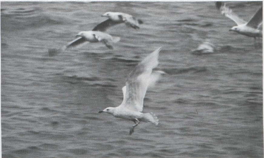
14 Leucistische Zilvermeeuw Larus argentatus in eerste zomerkleed, Harlingen, Friesland, juli 1979 (Joop Jukema)

Hals, borst, mantel, schouder en rug als in eerste zomerkleed. Middelste dekveren wit, overige met blauwgrijze zweem (18 september); op 15 oktober mantel, schouder, rug en dekveren egaal licht blauw-