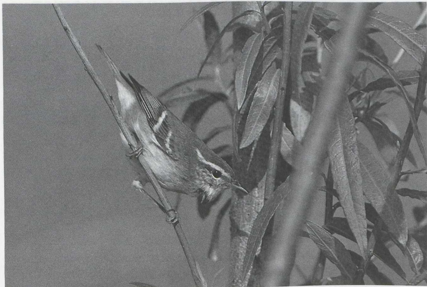
30 Bladkoninkje Phylloscopus inornatus , Maasvlakte, Zuidholland, oktober 1986