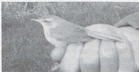
16 Veldrietzanger Acrocephalus agricola , Makkum, Friesland, oktober 1982 (Willem Bil)

Veldrietzanger ook al in oktober 1982 te Makkum Op 23 oktober 1982 werd op de Makkumer Zuidwaard te Makkum Fr door de Ringgroep Menork een karekiet Acrocephalus -achtige gevangen die niet op naam kon worden gebracht. De vogel werd om 11:30 aangetroffen in een mistnet in een rietstrook langs het water. Hij werd gefotografeerd en gefilmd in aanwezigheid van Willem Bil, Auke de Vries en J A de Vries (ringer). Omdat hij niet kon worden gedetermineerd werd de vogel ongeringd vrijgelaten.