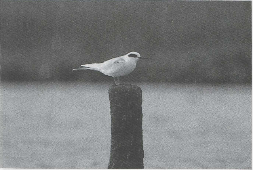
27 Forsters Stern Sterna forsteri , Ritthem, Zeeland, november 1986 28 Goudlijster Zoothera dauma , Katwijk, Zuidholland, oktober 1986