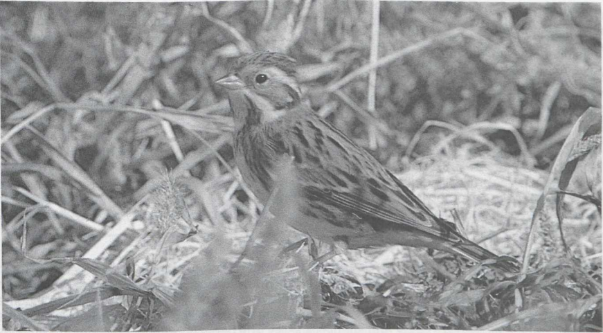
21 Bosgors Emberiza rustica , Israel, november 1986