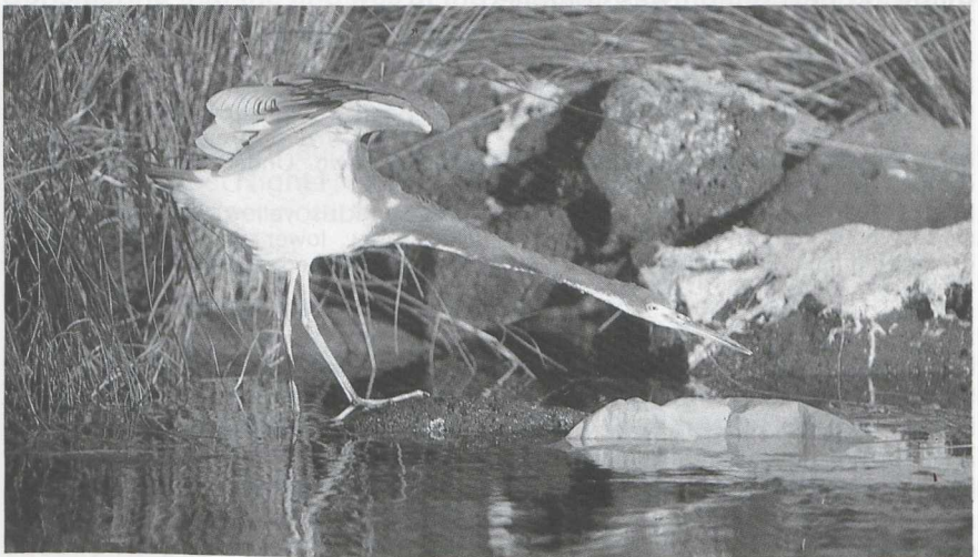
9 Tricolored Heron Egretta tricolor , Azores, October 1985 (John Parrott)

Situated in mid-Atlantic, the Azores archipelago is well-placed to receive landfalls of American migrants. Apart from Ring-billed Gull Larus delawarensis , which winters regularly in the Azores, there have been some 150 records of about 40 Nearctic species (le Grand 1983). This list includes very few passerines, but is otherwise broadly representative of the American migrants which reach Europe. Only three species recorded on the Azores have yet to be observed elsewhere in the western Palearctic: Little Blue Heron E caerulea , one ringed bird