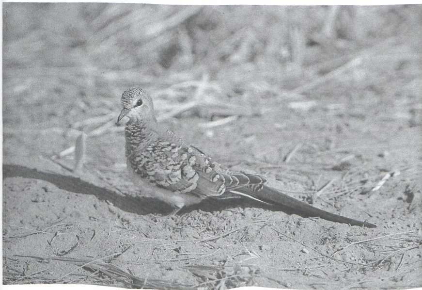
19 Namaqua Dove, juvenile, Israel, November 1986 (Arnoud B van den Berg)