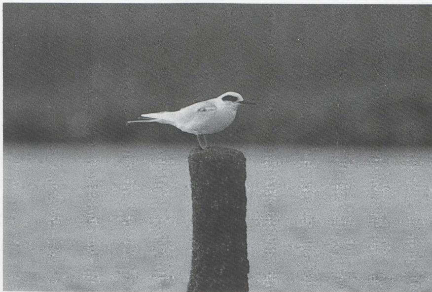
27 Forsters Stern Sterna forsteri , Ritthem, Zeeland, november 1986 ( René Pop ) 28 Goudlijster Zoothera dauma , Katwijk, Zuidholland, oktober 1986 ( Arie de Knijff )