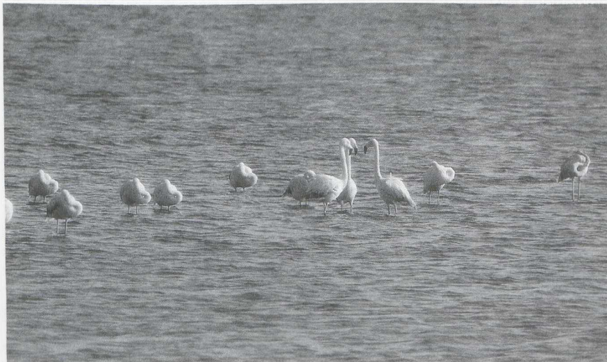
2 Chileense Flamingo's Phoenicopterus chilensis en één Caraïbische Flamingo P ruber ruber (rechts), Herkingen, Zuidholland, oktober 1982

verspreidingsgebied van deze soort en het voorkomen in Europa (twee gevallen in Spanje in 1966 en 1972) is het waarschijnlijk dat het evenals de Caraïbische en Chileense Flamingo's een vogel uit gevangenschap betrof. De soort wordt minder in gevangenschap gehouden dan de Euraziatische/ Caraïbische en de Chileense Flamingo hoewel het verreweg de talrijkste flamingosoort ter wereld is (Kear & Duplaix-Hall).