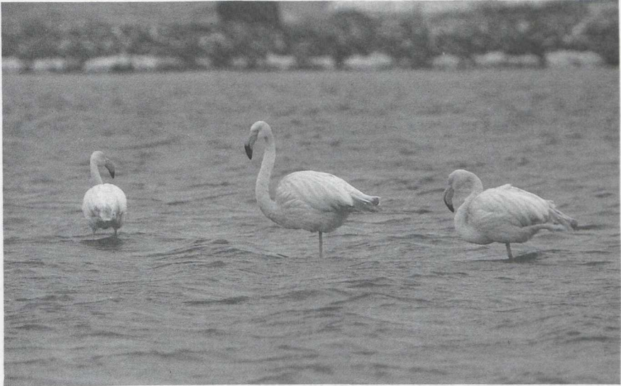
1 Euraziatische Flamingo's Phoenicopterus ruber roseus , Oostvoornse Meer, Zuidholland, februari 1985 (Arnoud B van den Berg)

gen in te zenden, werden voor de periode 1975-84 c 100 gevallen ontvangen van in totaal c 600 vogels.