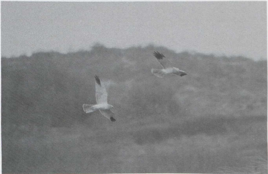
12 Steppekiekendief Circus macrourus , mannetje, & Blauwe Kiekendief C cyaneus , mannetje, Schiermonnikoog, Friesland, mei 1985

Hoewel de grootte van de Steppekiekendief overeen kwam met die van een mannetje Blauwe Kiekendief C cyaneus , maakte hij een beduidend rankere indruk. Dit werd veroorzaakt door de duidelijk smallere en puntiger vleugels en de krachtiger, meer dansende vlucht. De vogel