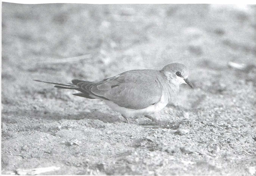
18 Namaqua Dove Oena capensis , female, Israel, April 1984 (Edward J van IJzendoorn)