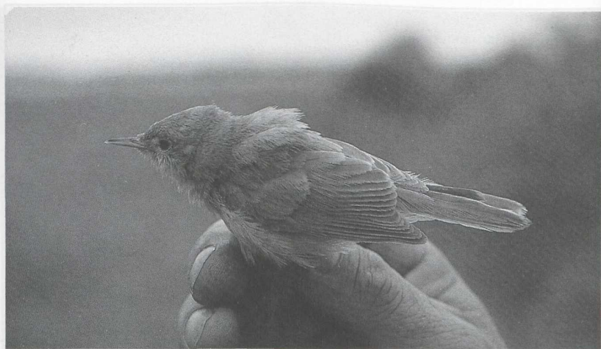
29 Kleine Spotvogel Hippolais caligata , Almere, Flevoland, oktober 1986 (Karel A Mauer)

IJSVOGELS TOT GORZEN Op 4 oktober werd er één Hop Upupa epops gezien bij Kijkduin Zh en twee bij Scheveningen. Op 14 en 15 oktober zat er één bij Lossers O en op 15 oktober ook één bij Heemskerk Nh. Van begin oktober tot begin november was er veel doortrek van Strandleeuweriken Eremophila alpestris . Grote Piepers Anthus richardi werden gemeld begin oktober bij Maarn, van 4 tot 13 oktober op de Maasvlakte, op 5 oktober bij Uitbergen Ovl, op 11 oktober op Texel, op 14 oktober bij Wuustwezel A, op 17 oktober bij Castricum, op 18 en 30 oktober bij Katwijk, op 18 oktober bij Zalk O (twee), op 29 oktober bij Den Oever Nh en op 9 november bij Kijkduin. De laatste Duinpieper A campestris werd op 27 oktober in De Kennemerdunnen gemeld. Roodkeelpiepers A cervinus waren er van 1 tot 3 oktober in de Eemshaven Gr, begin oktober één (vangst) bij Niel A en enkele bij Lokeren Ovl en op 5 oktober één (vangst) bij Uitbergen. Vanaf 14 december werden weer op diverse plaatsen kleine aantallen Pestvogels Bombycilla garrulus gezien. Op 29 en 30 oktober zat er een Waterspreuw Cinclus cinclus bij Katwijk, op 8 november één bij Middelburg Z en op 12 en 13 november één bij Zevenhuizen Zh. De eerste Perzische Roodborst Irania gutturalis voor Nederland, die op 3 en 4 november te Maasland Zh zat, zorgde kort na de Forsters