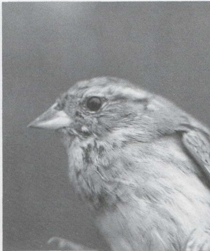
32 Roodmus Carpodacus erythrinus , Koog aan de Zaan, Noordholland, november 1986 (Guus Hak) 33 Maskergors Emberiza spodocephala , Westenschouwen, Zeeland, november 1986 (Aad Vuyk)

november was er een invasie van Grote Barmsijzen Carduelis flammea flammea met op 7 november 2500 en op 13 november 1500 te Katwijk en op 12 en 13 november 5500 bij Kijkduin. De volgende vangsten van Witsuitbarmsijzen C. hornemanni werden ons gemeld: begin november AW-duinen Nh, Leuven B, Aalst Ovl en Schelle A en op 14 en 23 november en 10 december bij Tongeren O. Begin augustus werden er aan de kust van België al verschillende Witbandkruisbekken Loxia leucoptera gevangen. Op 27 september en 3 oktober werd op Vlieland dezelfde Roodmus Carpodacus erythrinus gevangen. Van 15 tot 17 november zat er een vrouwtje bij Koog aan de Zaan Nh. Van 6 tot 8 november werd bij Vijfhuizen Nh een mannetje Mexicaanse Roodmus C. mexicanus gezien. Op 18 oktober werd op Texel een Bosgors Emberiza rustica gemeld. Dwerggorzen E. pusilla waren er op 23 september op Vlieland (vangst), op 16 en 17 oktober op Texel, op 27 oktober bij Katwijk, op 9 november bij Kijkduin en op 12 november bij Castri-