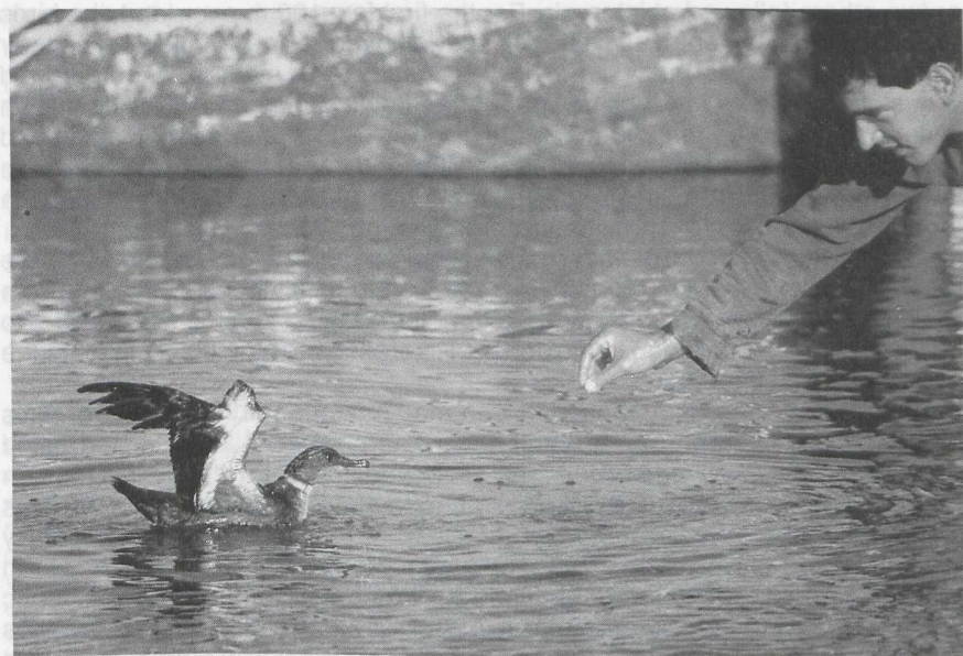
98-99 The author and Sooty Shearwater Puffinus griseus , Israel, June 1984 (Y Gollun)