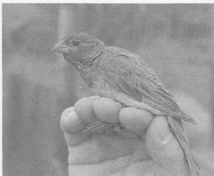
115 Veldrietzanger Acrocephalus agricola , Oostvaardersdijk, Flevoland, september 1987 (Karel A Mauer) 116 Roodmus Carpodacus erythrinus , mannetje, De Kennemerduinen, Noordholland, september 1987 (Erik J Maassen)

Veldrietzanger A agricola voor Nederland was de vangst van een exemplaar op 8 september langs de Oostvaardersdijk. De vogel werd de volgende dag nogmaals gevangen maar kon niet buiten het net geobserveerd worden. Een Baardgrasmus Sylvia cantillans werd op 3 september bij Knokke-Zwin Wvl gevangen. Een juveniele Sperwergrasmus S nisoria werd op 10 en 11 augustus bij Lier A gesignaleerd. Vangsten van juveniele exemplaren waren er eind augustus bij Aalst Ovl (twee), op 23 en 30 augustus en 1 september bij Knokke-Zwin, op 31 augustus bij Ransart H, op 1 september bij Heine Ovl, op 1, 3 en 19 september in De Kennemerduinen en op 2 september op de Westplaat. Op 4 september werd er nog één in Meijendel gezien. Grauwe Fitissen Phylloscopus trochiloides werden gezien op 1 september bij Zeebrugge en op 8 september bij Leeuwarden Fr. Op 12 september werd een Noordse Boszanger P borealis gemeld bij Tienen B. Op 27 september verscheen het eerste Bladkoninkje P inornatus op Texel en op 29 september waren er exemplaren bij Emmeloord Fl, bij Castricum (twee vangsten) en in De Kennemerduinen (vangst). Op 30 sep-