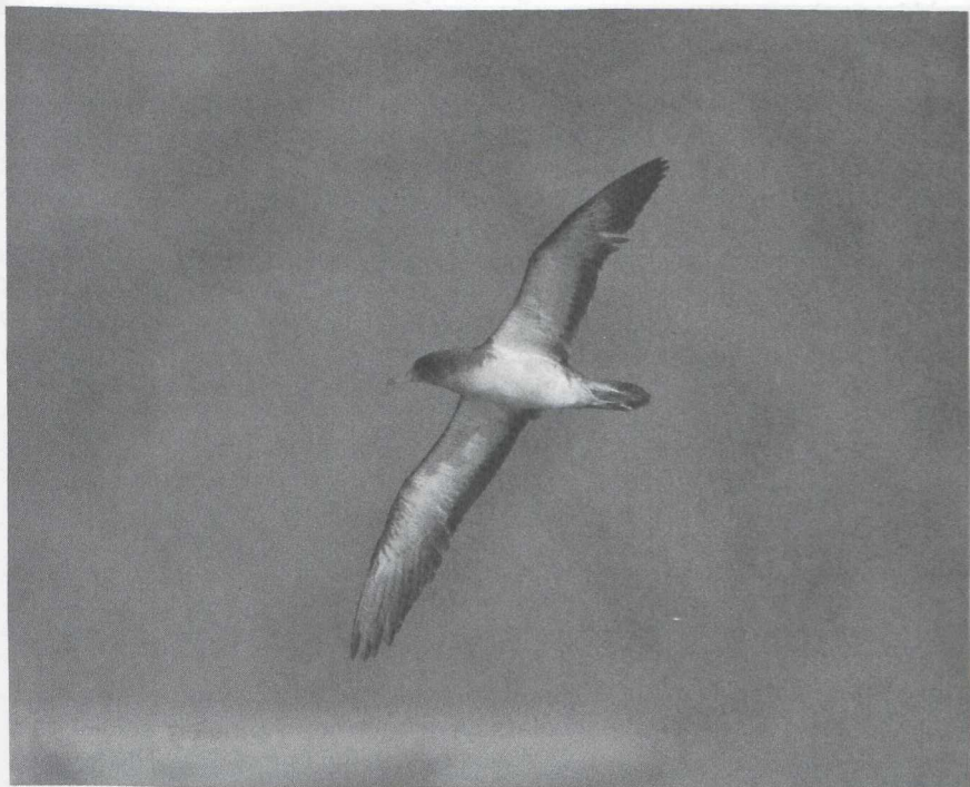
97 Cory's Shearwater Calonectris diomedea , Israel, September 1984 (Andrew S Butler)

1983 (Bezzel 1987). Therefore, it came as a surprise to find many Cory's Calonectris diomedea and Sooty Shearwaters P griseus at Eilat since the mid-70s. These two species are not even known to occur regularly in the northwestern Indian Ocean, let alone in the Red Sea or the Gulf of Eilat.