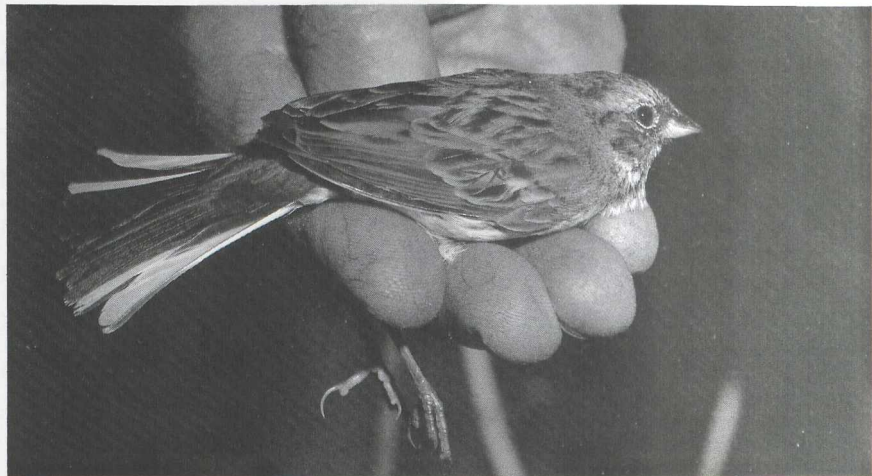
94 Black-faced Bunting Emberiza spodocephala , Lekkerkerk, Zuidholland, January 1987, trapped at Westenschouwen, Zeeland, November 1986 (Arnoud B van den Berg) 95 Little Bunting E pusilla , Castricum, Noordholland, November 1986 (Hans Schekkerman)