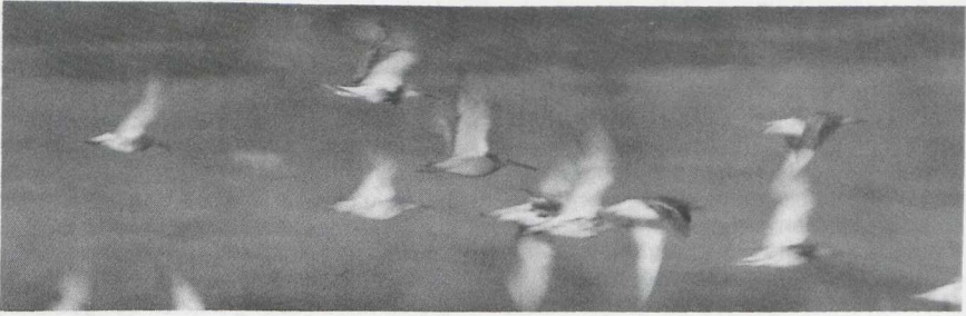
113 Grote Grijze Snip Limnodromus scolopaceus met Krombekstrandloper Calidris ferruginea en Kemphanen Philomachus pugnax , Lauwersmeer, Groningen, juli 1987 (Arnoud B van den Berg)

KRAANVOGELS TOT ALKEN In juli en augustus verbleven twee Kraanvogels Grus grus in de Lauwersmeer en van 16 augustus tot 1 september één exemplaar op Texel. Steltkluten Himantopus himantopus waren er op 6 juli in de Vlietlanden Zh, van 8 tot 17 juli één en tot 1 augustus een paartje bij Kallo-Doel en op 17 en 18 september één in de Weevers Inlaag Z. Op 27 september vlogen er twee over Bloemendaal Nh. Een Griël Burhinus oedicanus werd op 26 september bij Hoogkerk Gr gezien. Doortrekken- de Morinelplevieren Charadrius morinellus werden gezien op 9 augustus (drie) en op 30 augustus (één) bij Kijkduin, op 30 augustus (één) en op 2 september (zes) op de Maasvlakte Zh, op 3 september in de Eemshaven, op 5 september bij Katwijk, op 16 september in De Kennemerduinen (drie), op 17 september bij Castricum, op 19 september bij Camperduin, op 21 september op Texel, op 26 september op Terschelling Fr en op 28 september op Schiermonnikoog Fr. Alleen op de Maasvlakte pleisterden Morinellen (drie) van 25 augustus tot 7 september. Op 17 augustus werd een Witstaartkievit Chettusia leucura geclaimd bij Pannerden Gld. Van 10 tot 22 september bevond zich een juveniele Amerikaanse Gestreepte Strandloper Calidris melanotos bij Zelzate Ovl en op 23 september dook er één op bij Buggenum L die daar tot 3 oktober bleef. Op 7 juli werd een Breedbekstrandloper Limicola falcinellus op Schiermonnikoog opgemerkt. Op 26 augustus verbleef er één bij Vatrop Nh en mogelijk dezelfde vogel zat die avond in de