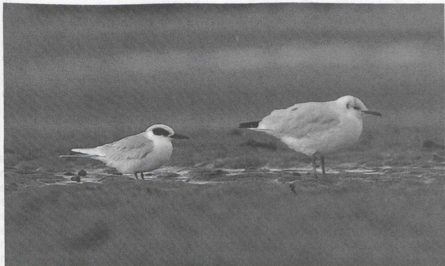
100 Forsters Stern Sterna forsteri en Kokmeeuw Larus ridibundus , Ritthem, Zeeland, november 1986

De volgende ochtend waren de meest enthousiaste vogelaars uit Nederland en België al een uur voor zonsopgang bij de Sloehaven aanwezig. Om 7:30 werd de Forsters Stern vliegend boven de Westerschelde en de Sloehaven gezien. Hij werd hier en op een nabijgelegen strand de gehele dag waargenomen. 's Middags kreeg hij enige tijd gezelschap van een Grote Stern S sandvicensis . Enkele 100en vogelaars kwamen hem bekijken. De volgende dagen werd de vogel niet meer teruggezien.