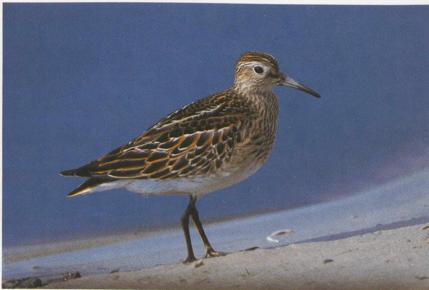
111 Amerikaanse Gestreepte Strandloper Calidris melanotos , Zelzate, Oostvlaanderen, september 1987 ( Filip Bogaert ) 112 Breedbekstrandloper Limicola falcinellus , Petten, Noordholland, september 1987 ( Peter de Knijff )