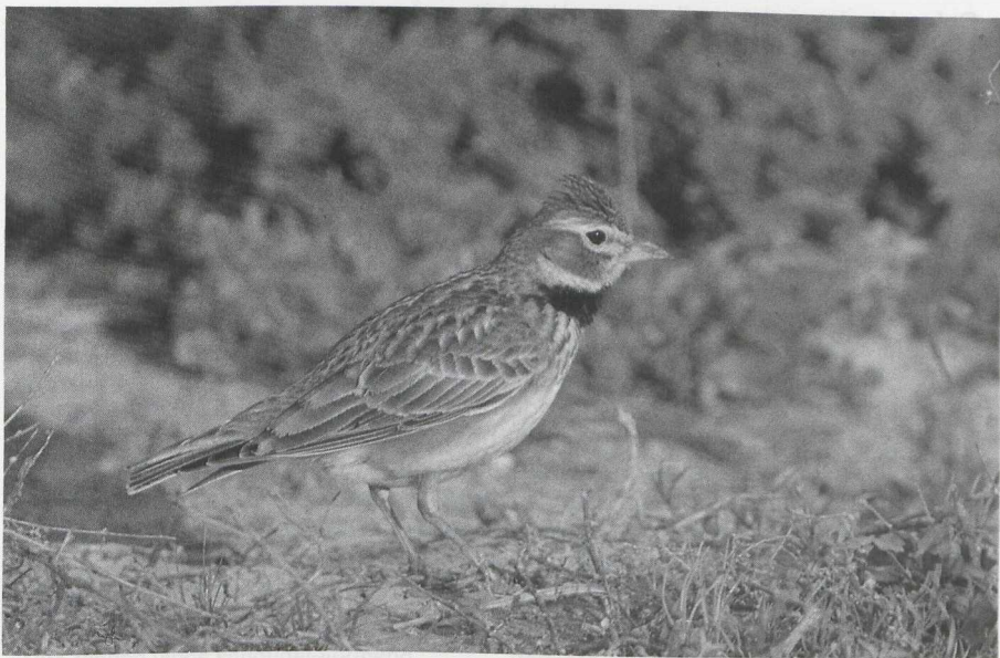
105 Calandra Lark Melanocorypha calandra , Turkey, April 1987 106 Bimaculated Lark M bimaculata , Turkey, May 1987 (Arnoud B van den Berg)