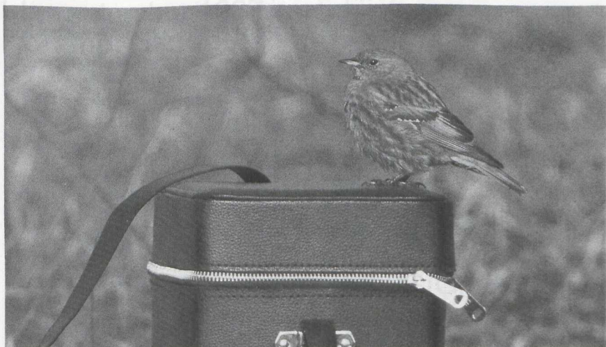
102 Alpenheggemus Prunella collaris , Groningen, Groningen, April 1986 (René van Rossum)