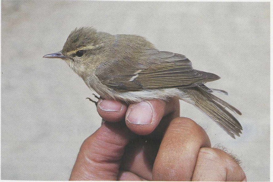
103 Green Warbler Phylloscopus nitidus , Turkey, May 1987 (Arnoud B van den Berg) 104 Two-barred Greenish Warbler P plumbeitarsus , Scilly, England, October 1987 (David M Cottridge)