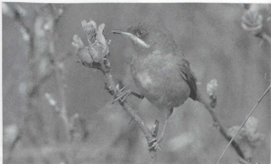
92 Subalpine Warbler Sylvia cantillans , male, Schoorl, Noordholland, May 1986