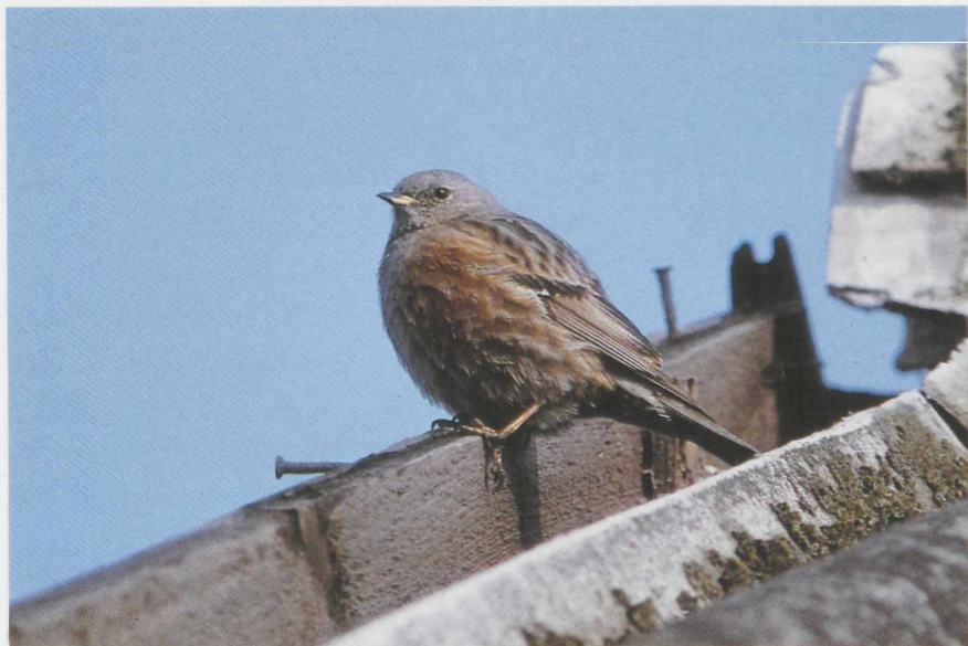
89 Alpine Accentor Prunella collaris , Groningen, Groningen, April 1986 (René van Rossum) 90 Hume's Yellow-browed Warbler Phylloscopus inornatus humei , Delft, Zuidholland, February 1983 (René van Rossum)