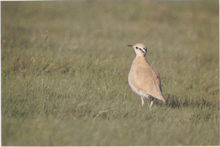
22 Renvogel Cursorius cursor , Texel, Noordholland, oktober 1986 23 Perzische Roodborst Irania gutturalis , Maasland, Zuidholland, november 1986