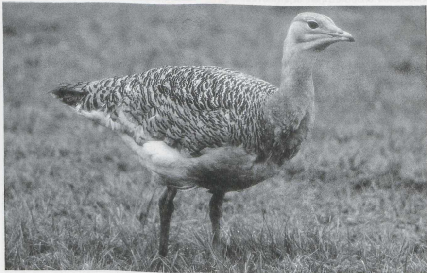
53 Grote Trap Otis tarda , Beltrum, Gelderland, januari 1986 (Paul Knolle).

trekgolf over België met op 16 maart meer dan 2500 vogels bij Torgny Lx. Het mannetje Kleine Trap Tetrax tetrax dat op 18 januari langs het Nulderpad bij Zeewolde Fl werd ontdekt, verscheen op de volgende dag in de Polder Arkemheen bij Nijkerk Gld en werd daar op 20 januari voor het laatst gezien. Dit was de tweede waarneming van deze soort in Nederland sinds 1959. Vanaf 9 januari tot ver in februari verbleef een eerste winter mannetje Grote Trap Otis tarda bij Beltrum Gld.