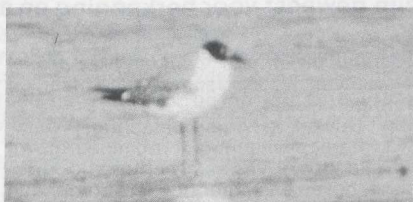
44 Laughing Gull Larus atricilla , Greece, August 1984 (Per Ole Syvertsen).

secondaries. Underparts and tail white. BARE PARTS Bill blackish though basal third blackish-red. Leg blackish.