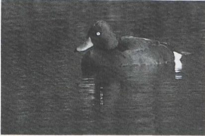
49 Witoogeend Aythya nyroca , Overveen, Noordholland, februari 1986 (Arnoud B van den Berg). 50 Buffelkopeend Bucephala albeola , Cuijk, Noordbrabant, februari 1986 (Guus Hak).

Ringsnaveleend Aythya collaris ook een mannetje hybride Ringsnaveleend x Kuifeend A fuligula gezien. De volgende Witoogeenden A nyroca waren al vanaf het begin van het jaar aanwezig: tot ten minste 2 maart maximaal drie op de