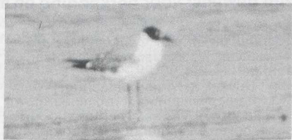
44 Laughing Gull Larus atricilla , Greece, August 1984 (Per Ole Syvertsen).

secondaries. Underparts and tail white. BARE PARTS Bill blackish though basal third blackish-red. Leg blackish.