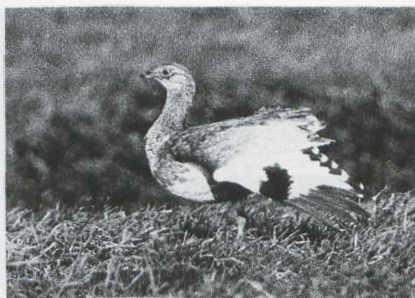
52 Kleine Trap Tetrao tetrao , Nijkerk, Gelderland, januari 1986 (Guus Hak).

KRAANVOGELS TOT ALKEN Bij Saeftinge bevond zich tot 29 januari een adulte Kraanvogel Grus grus . Op 15 en 16 januari verbleef een onvolwassen vogel bij Har-chies. Tussen 14 en 17 maart was er een