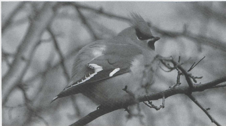
55 Pestvogel Bombycilla garrulus , adult, Wijk bij Duurstede, Utrecht, februari 1986 (René Pop).

januari waren er maximaal vier te Almere, op 16 januari één bij Driebergen U, op 19 januari twee te Kontich A, op 25 januari één bij Rilland Z, op 26 januari c 24 bij Hijker-Smilde D, de eerste twee weken van februari maximaal 10 bij Wijk bij Duurstede U, van 9 tot 27 februari drie bij Vorst B, in de tweede week van februari c 16 te Groningen Gr, op 18 februari drie en op 22 februari acht te Enschede O, op 21 februari enkele te Huizen Nh, op 26 februari twee te Schagen Nh en in de derde week van februari drie bij Kortrijk. De Waterspreeuw Cinclus cinclus van Wageningen Gld zat daar tot zeker 24 januari. Eind december werd enkele keren een exemplaar gezien langs de Dinkel nabij Denekamp O. Op 7 februari zat er één in Sonsbeek te Arnhem Gld, op 23 februari één te Groningen en op 26 februari één bij Diepenheim O. Het in oktober 1985 in Zuidelijk Flevoland gevangen vrouwtje Kleine Zwartkop Sylvia melanocephala (DB 8: 39, 1986) bleek na bestudering van het fotomateriaal een Cinereus Warbling-Finch Poospiza cine-