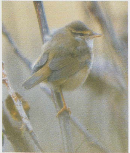
21 Brilgrasmus Sylvia conspicillata , IJmuiden, Noordholland, november 1984 (René van Rossum). 22 Raddes Boszanger Phylloscopus schwarzi , Maasvlakte, Zuidholland, oktober 1981 (Arie de Knijff). 23 Pallas' Boszanger P proregulus , Camperduin, Noordholland, oktober 1982 (René van Rossum).