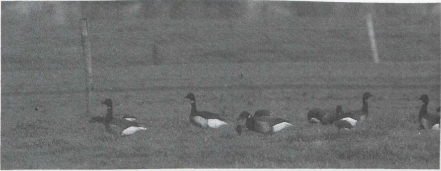
28 Rotganzen Branta bernicla bernicla en Zwartbuikrotgans B b nigricans , Hippolytus-hoef, Noordholland, november 1985 (Arnoud B van den Berg).