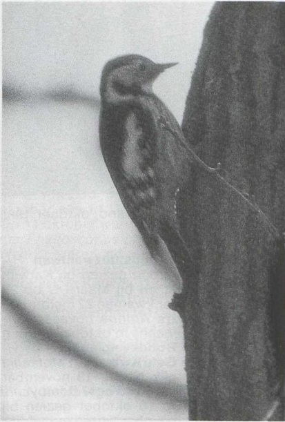
34 Middelste Bonte Specht Dendrocopos medius , Nieuw Amelisweerd, Utrecht, december 1985 (René Pop).

vlakte. Op 23 september werd te Schellinkhout Nh een adulte Poelruiter Tringa stagnatilis gezien. Op 13 oktober werd er een Rosse Franjepoot Phalaropus fulicarius gezien te Dudzele en daarna tussen 10 en 17 november nog een aantal langs de kust, met een maximum van vijf te Schevingen Zh op 14 november. Grote aantallen Middelste Jagers Stercorarius pomarinus in de eerste twee weken van november boden vele waarnemers de mogelijkheid deze soort beter te leren kennen. Op 7 en 11 november werden er in totaal vele 100-en gezien te Camperduin, IJmuiden, Bloemendaal en Scheveningen terwijl ook langs de Belgische kust de hoogste aantallen ooit geteld werden vastgesteld. Tot ver in december waren op diverse plaatsen nog exemplaren aanwezig. Ook in het binnenland waren er waarnemingen en vondsten. In oktober en november zaten maximaal vier Kleinste Jagers S longicaudus bij Zeebrugge. Verder waren er Kleinste Jagers te Enschede op 31 oktober, op de Maasvlakte op 6 november, bij Schevingen op 7 november en bij Den Oever op 24 november. Ook nu werden op verschillen-