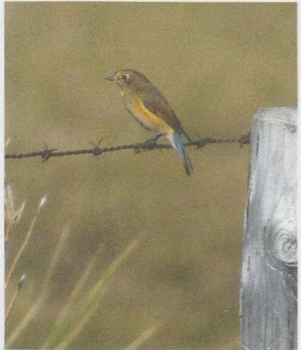
18 Woestijnplevier Charadrius leschenaultii , Terschelling, Friesland, augustus 1984 (René van Rossum). 19 Blauwstaart Tarsiger cyanurus , Texel, Noordholland, september 1985 (Peter de Knijff). 20 Citroenkwikstaart Motacilla citreola , Castricum, Noordholland, september 1984 (Huub Huneke).