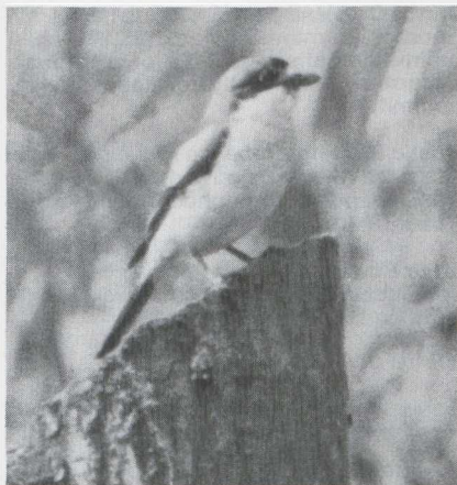
6 Woodchat Shrike Lanius senator , Knardijk, Flevoland, June 1983.