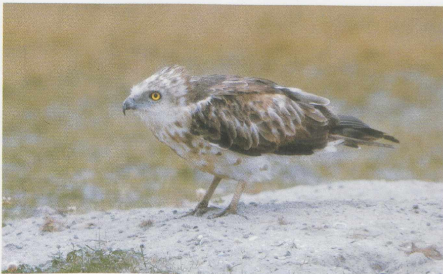
14 Slangenarend Circaetus gallicus , Maasvlakte, Zuidholland, augustus 1981 (René Pop) 15 Steppiekievit Chettusia gregaria , Schiermonnikoog, Friesland, augustus 1982 (René Pop).