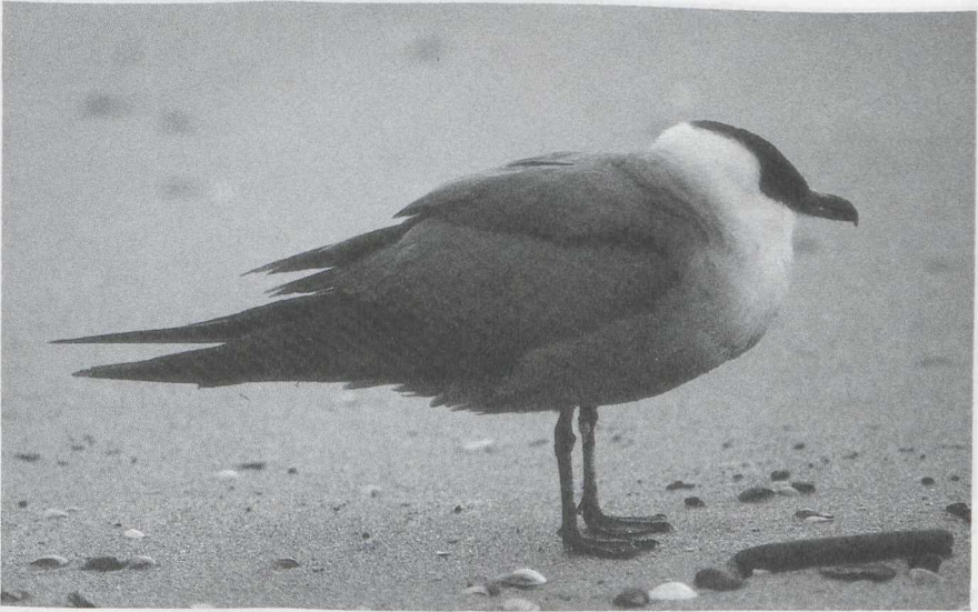
31 Kleinste Jager ( Stercorarius longicaudus , Zeebrugge, Westvlaanderen, november 1985.

Lauwersmeergebied. Dat de Nijlgans Alopochen aegyptiacus het steeds beter doet, moge blijken uit de waarneming van een groep van c 180 vogels bij Wassenaar Zh eind december. In dezelfde tijd werd een mannetje Zomertaling Anas querquedula aangetroffen bij Wessem L. De bekende Ringsnaveleend Aythya collaris van de Maasplassen tussen Roermond L en Wessem werd weer gezien vanaf 24 november. De vogel verbleef ook enige tijd in de Heelderpeel te Grathem L. Witoogeenden A nyroca werden gezien bij Voorst op 23 oktober en afwisselend op de E10-plassen te Minderhout/Meer A en het Galdersche Meer Nb tussen 23 oktober en 9 december. Tevens waren er Witoogeenden te Hazelbeke Wvl op 18 november, bij Linne L op 8 december, langs de Brouwersdam op 14 december, op de Reeuwijkse Plassen Zh op 27 december en bij Namen in de laatste week van december. Hybriden Tafeleend A ferina x Witoogeend werden waargenomen bij Meer en te Hazelbeke in november. Ook werden er weer hybriden Tafeleend x Kuifeend A fuligula ontdekt: op de E10-plassen/Galdersche Meer één of twee van 6 tot 13 december en op de Maasplassen bij Wessem drie op 27 december. Voor Ijseenden Clangula hyemalis was de