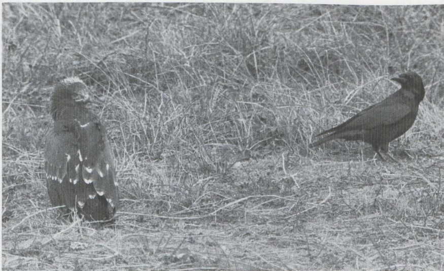
3 Schreeuwarend Aquila pomarina en Zwarte Kraai Corvus corone corone , Katwijk aan Zee, Zuidholland, november 1984 (Edward J van IJzendoorn).

vorm van het neusgat (rond) sluit alle Aquila -soorten uit behalve Bastaardarend. De versmalling van de buitenvlag van p7, de vleugelformule, de snavel lengte, de snavel hoogte en de vleugellengte sluiten Bastaardarend vrijwel uit (Glutz von Blotzheim et al 1971, Svensson 1975, Cramp & Simmons 1980, Forsman 1984). Kenmerkend voor een eerste kalenderjaar vogel is het ontbreken van actieve rui aan slagpennen en staart. De lichte vlekken op de bovenvleugeldekveren en de lichte kruinplek wijzen op de Europese ondersoort A p pomarina (cf Cramp & Simmons). De slagpennen zijn zwak gebandeerd. Deze bandering is het best zichtbaar op de binnenste handpennen en lijkt duidelijker dan zoals deze in de literatuur voor juveniele Schreeuwarend wordt aangegeven.