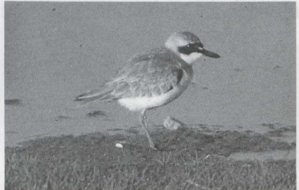
26 Greater Sand Plover Charadrius leschenaultii , Norway, June 1985 (Henk-Jan Udding).

Henk-Jan Udding, Prinses Margrietstraat 33, 1901 DD Castricum