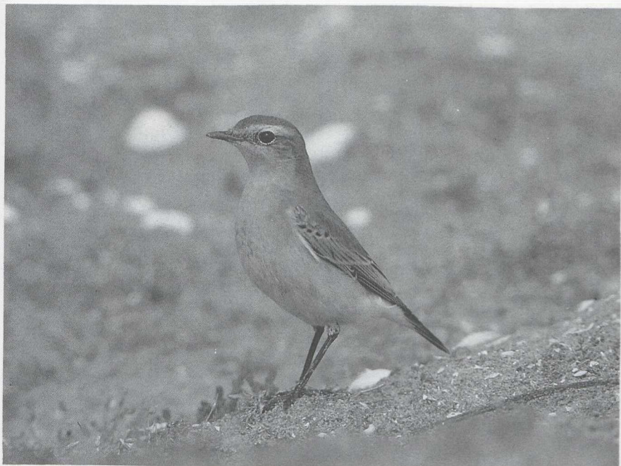
11 Wheatear Oenanthe oenanthe , Maasvlakte, Zuidholland, August 1984 (Arie de Knijff).

wings and the upperparts of Isabelline. Since the mystery photograph was taken in April, the wing pattern should rule out Wheatear. In fresh winter plumage when Wheatear shows fairly wide pale fringes to coverts and remiges, the difference is much less than in spring. In Wheatear the centres of coverts and remiges are, however, considerably darker with more clear-cut and slightly narrower fringes. This is usually obvious on median and at least some greater coverts (on those on which parts of the dark centres are exposed). Thus, the dark alula does usually not stand out as in Isabelline. In Wheatear in fresh plumage, the breast is normally fairly rich rufous-buff, contrasting with paler belly; the throat is usually slightly paler than the breast. In Isabelline the underparts are generally paler and more uniformly buffish, frequently with a paler throat and short submoustachial stripes. Differences in underparts are, however, often very slight. The dark terminal bar of the tail is noticeably wider in Isabelline. The underwing is much paler in Isabelline due to the whitish axillaries, underwing-coverts and edges to the remiges. Wheatear has dark axillaries and underwing-coverts with rather broad pale fringes. So, the mystery bird is an Isabelline Wheatear, photographed by Edward van IJzendoorn in Israel in April 1984.