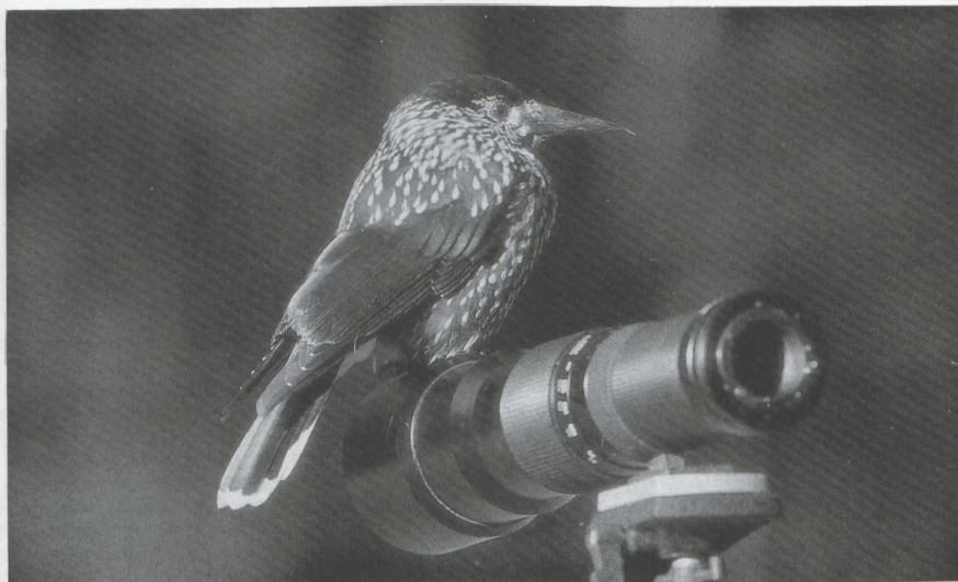
38 Notekraker Nucifraga caryocatactes , Katwijk, Zuidholland november 1985.

gevallen te Antwerpen, Gent Ovl, De Haan Wvl (vangst), Heusden Olv en Zeebrugge. Een late vogel werd op 16 november door een kat binnengebracht te Empel Nb. Er was een kleine influx van Taigaboomkruipers Certhia familiaris met waarnemingen op Texel op 8 en 10 oktober, te Ede Gld op 10 oktober (twee), op Schiermonnikoog op 16 oktober (twee vangsten), bij Bilthoven U op 20 oktober en te Maarn op 24 oktober (drie). Tot eind december zouden er twee op Schiermonnikoog aanwezig zijn geweest. Op 5 oktober werden op Ameland twee Buidelmezen Remiz pendulinus gezien. Bij Lier werden vanaf 25 september tot eind oktober in totaal 13 exemplaren waargenomen. Voorts waren er op 30 september drie bij Bloklersdijk en op 27 november nog één bij Harchies. Buiten de gewone binnenlandswaarnemingen werden er langs de kust veel doortrekkende Klapeksters Lanius excubitor gezien. In de tweede decade van oktober zouden er in het Bargerveen meer dan 20 aanwezig zijn geweest. Van begin oktober tot begin december was er een