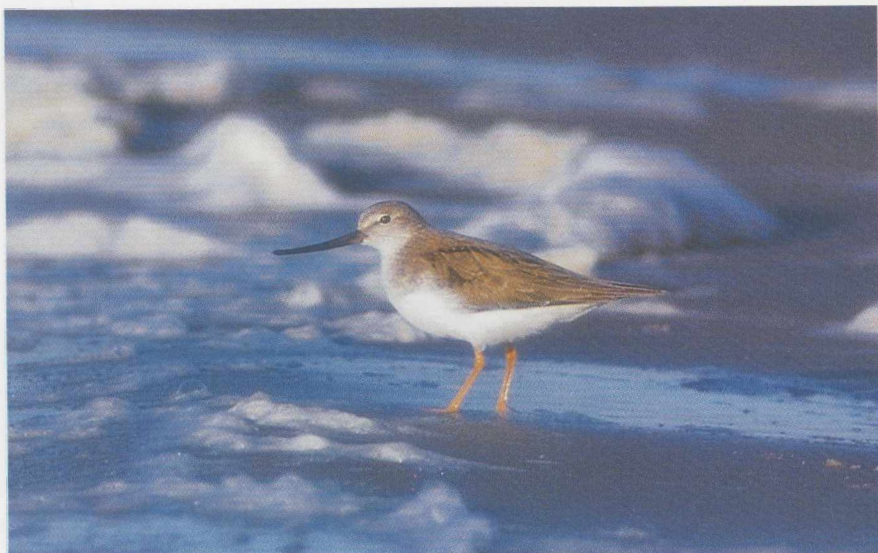
16 Terekruiter Xenus cinereus , Huizen, Noordholland, juni 1985 (Karel A Mauer). 17 Dougalls Stern Sterna dougallii , Vlissingen, Zeeland, september 1984 (René Pop).