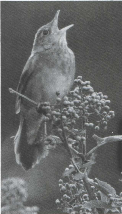
5 River Warbler Locustella fluviatilis , Midwolda, Groningen, June 1983 (Arnoud B van den Berg).