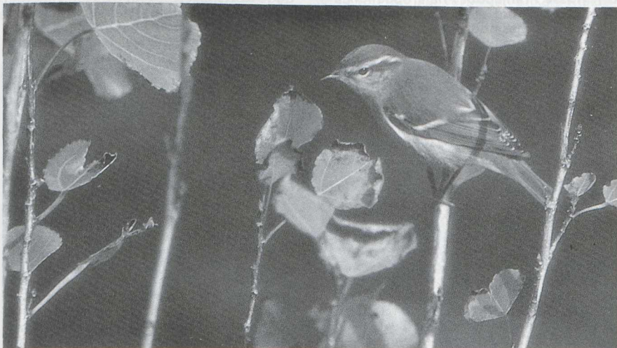
36 Bladkoninkje Phylloscopus inornatus , Maasvlakte, Zuidholland, oktober 1985 (René Pop).

Langsvliegende Roodstuitzwaluwen Hirundo daurica werden gezien bij Katwijk Zh op 20 oktober en bij Maarn U op 23 oktober. In oktober kwamen 22 meldingen van Grote Piepers Anthus novaeseelandiae binnen. Eveneens in oktober werden op zes plaatsen Roodkeelpiepers A cervinus gezien. Een Gele Kwikstaart Motacilla flava te Medemblik Nh op 19 november was laat. De eerste Pestvogel Bombycilla garrulus werd op 10 oktober gezien bij Rossum O. In november waren er meldingen te Oudega Fr en Hengelo O (twee). Rond de jaarwisseling verbleven er enkele op Schiermonnikoog Fr. Waterspreeuwen Cinclus cinclus waren aanwezig te Wor-