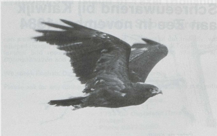
1-2 Schreeuwarend Aquila pomarina , Katwijk aan Zee, Zuidholland, november 1984.