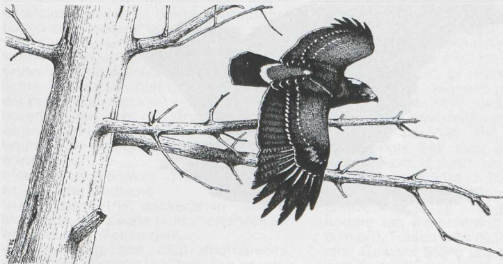
Peter de Knijff

Op 15 november 1984 ontdekte K Ente in de duinen tussen Katwijk aan Zee Zh en Wassenaarse Slag Zh een roofvogel die hij determineerde als Schreeuwarend Aquila pomarina . De vogel werd van 17 tot en met 20 november door verschillende waarnemers gezien. Hij vloog niet veel en zat vaak op de grond of in een boom, meestal omringd door Zwarte Kraaien Corvus corone corone en Eksters Pica pica . Minstens eenmaal werd geconstateerd dat hij naar een prooi dook maar daadwerkelijk vangen van prooi of eten van aas werd niet vastgesteld. Op 20 november werd hij, na overdag niet te zijn gezien, in de late namiddag zittend op de grond gevonden niet ver van de plaats waar hij de avond tevoren het laatst was gezien. De vogel bleek sterk verzwakt en kon worden opgepakt. Hij overleed nog dezelfde avond. De dode vogel werd geschonken aan het Rijksmuseum van Natuurlijke Historie te Leiden Zh.