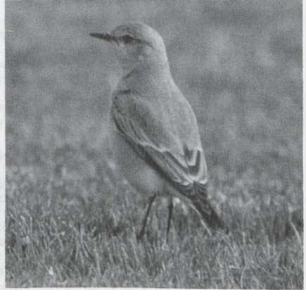
8-9 Isabelline Wheatear Oenanthe isabellina , Israel, April 1984 (Edward J van IJzendoorn).