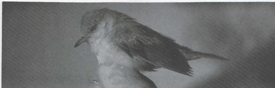
35 Sperwergrasmus Sylvia nisoria , De Kennemerduinen, Noordholland, oktober 1985.

perduin op 6 oktober en 7 november en te Schevingen op 7 november.