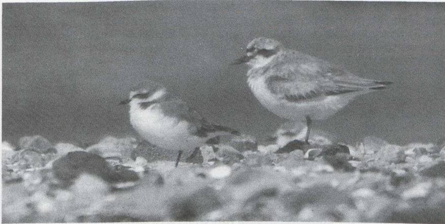
27 Woestijnplevier Charadrius leschenaultii en Strandplevier C alexandrinus , Den Oever, Noordholland, augustus 1985 (Peter Braam).

Griekenland 5, Groot-Brittannië 6, Malta 6, Nederland 3, Noorwegen 2, Polen 4 en Zweden 4.