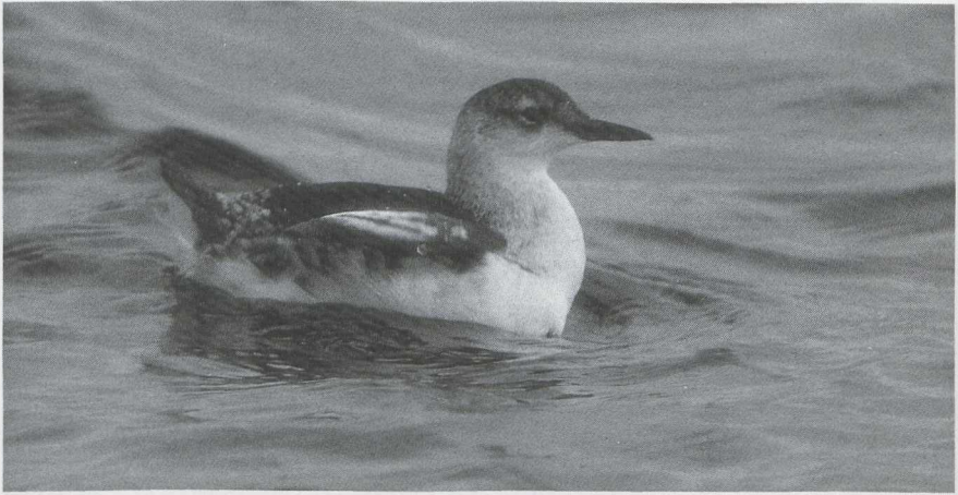
32 Zwarte Zeekoet Cephus grylle , Brouwersdam, Zuidholland, december 1985 ( Guus Hak ).

werd te Blokkersdijk een Bastaardarend Aquila clanga gemeld. Roodpootvalken Falco vespertinus werden gezien op 6 oktober op het Muiderzand FI, op 13 oktober te Sint Kruis-Winkel Ovl, een adult mannetje op de Maasvlakte op 14 oktober, in de tweede decade van oktober in het Bargerveen D (drie) en te Merksplas A op 23 oktober. Ook dit najaar werden er weer veel Slechtvalken F peregrinus gemeld. Zo zouden er maximaal zes in het Lauwersmeergebied hebben gezeten en waren er eind december drie bij Kallo-Doel A.