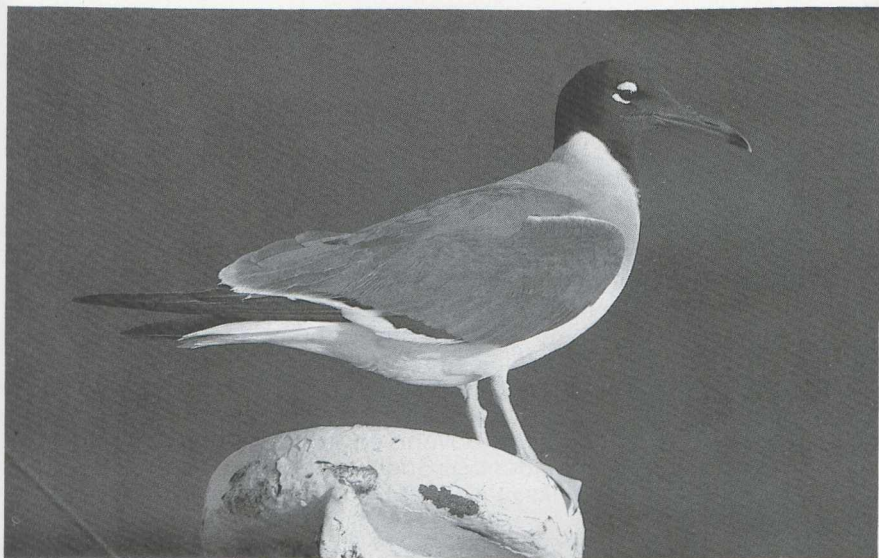
13 Witoogmeeuw Larus leucophthalmus in adult zomerkleed, Egypte, juni 1984 (Arnoud B van den Berg).

Kleur! Al geruime tijd leeft bij de redactie van Dutch Birding de wens om van tijd tot tijd foto's in kleur te kunnen plaatsen. Dankzij de genereuze medewerking van vele fotografen kunnen wij regelmatig over materiaal beschikken dat zich daartoe bij uitstek leent. Helaas gaan de financiële consequenties van een dergelijke onderneming onze draagkracht te boven. Het verheugt ons dan ook zeer dat DRUKKERIJ ALBÉDON/KLOP BV te Katwijk aan Zee Zh het ons thans mogelijk heeft gemaakt een aantal foto's in kleur af te drukken. Wij zijn DRUKKERIJ ALBÉDON/KLOP BV bijzonder erkentelijk voor deze geste, welke zeker verder zal bijdragen tot de reputatie die Dutch Birding op fotogebied heeft gevestigd. Het vakmanschap van DRUKKERIJ ALBÉDON/KLOP BV staat borg voor het beste resultaat dat wij ons wensen kunnen.