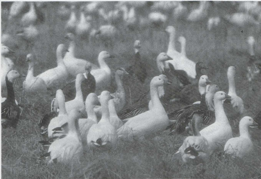
Mystery photograph 19. Solution in next issue.