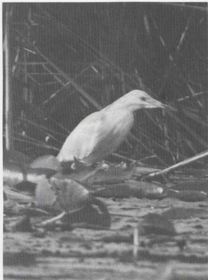
83 Squacco Heron Ardeola ralloides , Alblasserdam, Zuidholland, July 1984 ( J W de Roever ) 84 Lesser Spotted Eagle Aquila pomarina , Katwijk, Zuidholland, November 1984 ( René Pop )