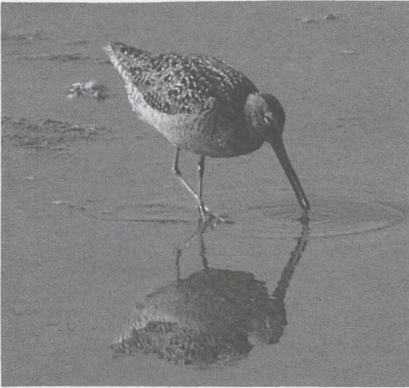
104 grijze snip Limnodromus griseus/scolopaceus , Flaauwers Inlagen, Zeeland, augustus 1986 (Alan Williams)

Terschelling, te Noordwijk Zh (drie) en te Wassenaar Zh (drie), op 15 augustus te Kallo Ovl, op 23 augustus één bij Kreileroord Nh, op 4 september één bij Aalten Gld en op 27 september twee langs de Knardijk. Op 5 augustus vlogen drie oievaarders Ciconia over Katwijk Zh en op 12 augustus 11 over de AW-duinen Nh. Op 5 september was er één bij Veenendaal U en op 13 september één in de Flevo. Op 12 september vlogen er niet minder dan 12 oievaarders over Middelburg Z en op 13 september waren er twee te Souburg Z. Voorpaginanieuws waren de 13 exemplaren die van 24 op 25 september overnachtten in het centrum van Turnhout A. De Zwarte Ibis Plegadis falcinellus bleef de gehele maand augustus te Schelle A tot hij op de 31ste te Blokkersdijk A overvliend werd waargenomen. Daarna verbleef hij op 2 september te Willebroek A en op 5 september te Niel A. Wie is er een Heilige Ibis Threskiornis aethiopicus kwijt? Op 4 juli zat er een te Ellewoutsdijk Z. De gehele zomer verbleef een Kleine Zwaan Cygnus columbianus langs de Oostvaardersdijk Fl. Het mannetje Blauwvleugeltaling Anas discors van Blokkersdijk zat daar van 3 tot 9 juli en werd daarna nog éénmaal te Kallo-Doel Ovl waargenomen, waar de vogel ook eind juni was signaleerd. Ten minste twee Ijseenden Clangula hyemalis overzomerden op Terschelling. Op 5 september werden er reeds negen gezien bij