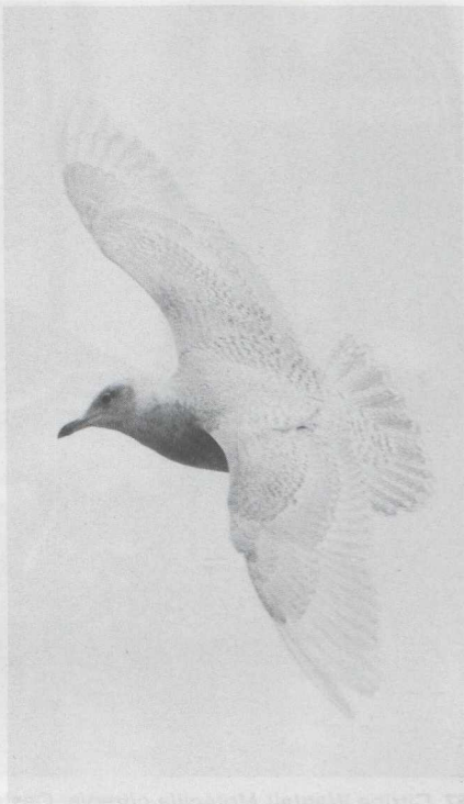
86 Iceland Gull Larus glaucooides , Lauwersoog, Groningen, January 1984 (Arnoud B van den Berg)

FLEVOLAND Lelystad, 14 August, trapped (C J Breek, R Leurs et al ).