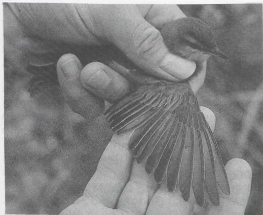
81-82 Roodoogvireo Vireo olivaceus , Rottumerplaat, Groningen, oktober 1985