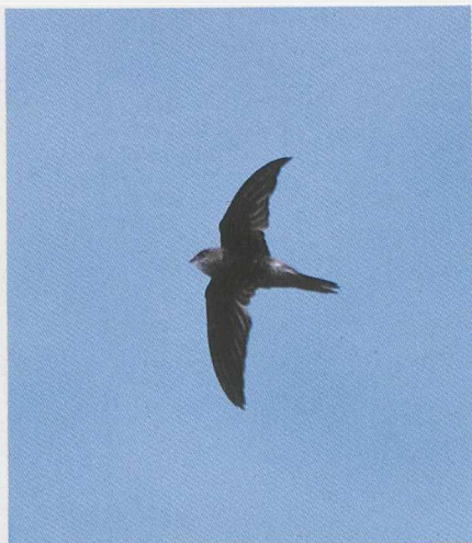
91-92 Cape Verde Swift Apus alexandri , Fogo, Cape Verde Islands, March 1986 ( René Pop ) 93 Grey-headed Kingfisher Halcyon leucocephala , São Tiago, Cape Verde Islands, February 1986 ( René Pop )