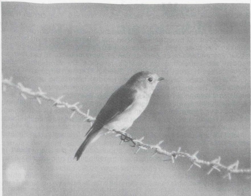
79 Blauwstaart Tarsiger cyanurus , Texel, Noordholland, september 1985

lijk was het een eerstejaars vogel omdat adulte vrouwtjes grijzer getint zijn op kop en mantel (Svensson 1984).