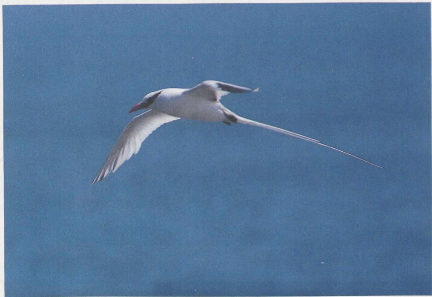
89 Red-billed Tropicbird Phaethon aethereus , and 90 Brown Booby Sula leucogaster , Razo, Cape Verde Islands, March 1986