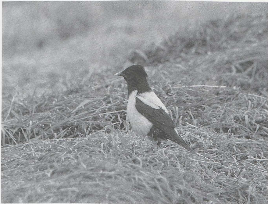
88 Rose-coloured Starling Sturnus roseus , Texel, Noordholland, June 1984