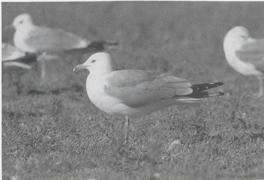
108 Ringsnavelmeeuw Larus delawarensis , Maasvlakte, Zuidholland, juli 1986

Piepers Anthus novaeseelandiae en Duinpiepers A campestris , voornamelijk langs de kust. Op de trektelpost bij Maarn werden in de tweede helft van september 15 tot 20 Duinpiepers genoteerd. Op 31 augustus waren er twee Roodkeelpiepers A cervinus bij Oostende, op 18 september één bij Castricum, op 27 september één op de Maasvlakte en eind september zes bij de Eemshaven. Op 12 september werd in het Flevopark te Amsterdam een Roodkeelijster Turdus ruficollis ruficollis geclaimd. Een juveniele Noordse Nachtegaal Luscinia luscinia werd op 17 augustus geringd te Knokke-Zwin Wvl. Op 23 en 25 augustus zat er een Waaiersaartrietzanger Cisticola juncidis te Zeebrugge. Eind juli werden er vier Waterrietzangers Acrocephalus paludicola gevangen op de Makumer Zuidwaard Fr, op 9 augustus werden er daar zelfs 12 en op 10 augustus vier gevangen. Op 8 augustus was er één te Blokkersdijk en van 13 tot 23 augustus werden er maximaal twee op de Westplaat waargenomen. Op 5 september werd er één gevangen bij Hamme Wvl, op 7