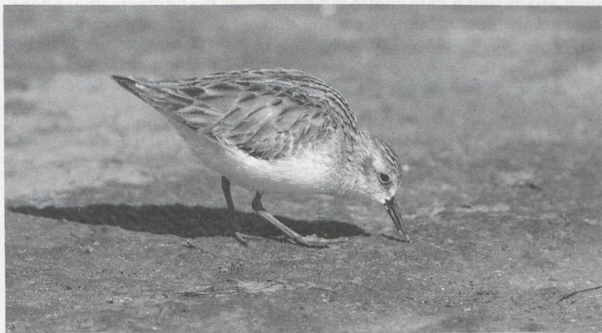
98 Least Sandpiper Calidris minutilla , Texas, February 1982

21 The squat appearance and short legs and bill of the wader in mystery photograph 21 obviously belong to one of the smaller sandpipers or stints Calidris . The rather plain-coloured upperparts tell that the bird is in winter plumage. Its pale legs limit our choice to three species: Temminck's Stint C temminckii , Long-toed Stint C subminuta