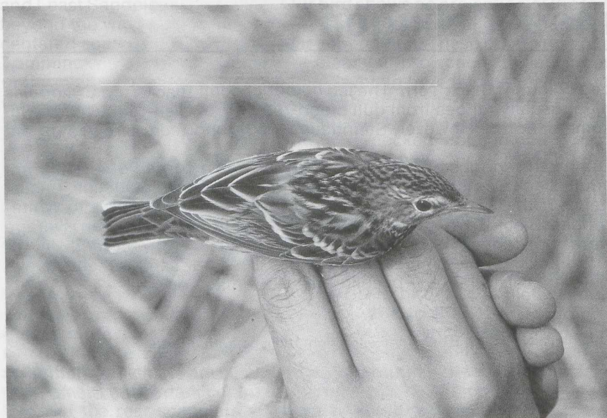
99-100 Pechora Pipit Anthus gustavi , Taiwan, October 1982 (Urban Olsson)