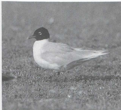
107 Zwartkopmeeuw Larus melanophthalmus , Maasvlakte, Zuidholland, juli 1986

waard Gld en op 7 september bij Hurwenen Gld. Op 27 juli werd er een Zwarte Zeekoet Cephus grylle in zomerkleed op de Westplaat gezien. Van 30 september tot 5 oktober werd er één enkele malen bij Camperduin gezien. Op 20 augustus zat er een Papegaaiduiker Fratercula arctica bij Het Zwin.