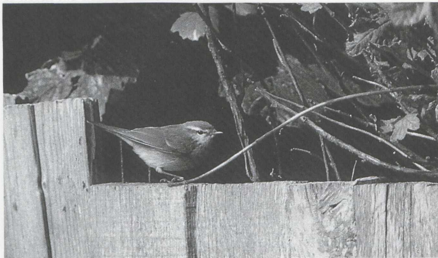
109 Grauwe Fitis Phylloscopus trochiloides , Texel, Noordholland, september 1986

Kleine Vliegenvangers Ficedula parva waren er op 12, 26 en 27 september te Heist en op 14 september bij Kijkduin Zh. De aanwezigheid van enkele Buidelmezen Remiz pendulinus van 10 tot 30 september langs de Oostvaardersdijk doet een broedgeval vermoeden. Van 28 september tot 17 oktober trokken er te Lier ten minste 34 Buidelmezen door, hierbij was een groep van zeven op 28 september en van 11 op 3 oktober. Op 6 september was er één bij Bloklersdijk, op 12 september één bij Den Oever, op 13 september bij Retie A en op 27 september één te Westkapelle. Een Roodkopklauwier Lanius senator werd op 11 augustus in de duinen bij Bergen Nh waargenomen. Op 8 augustus werd er een Raaf Corvus corax bij Gulpen L gezien. Op 1 juli zat er een Roodmus Carpodacus erythrinus bij Castricum. Vanaf 20 september trokken er weer opvallend veel IJsgorzen Calcarius lapponicus door en eind augustus-begin september de meeste Ortolanen Emberiza hortulana , met 20