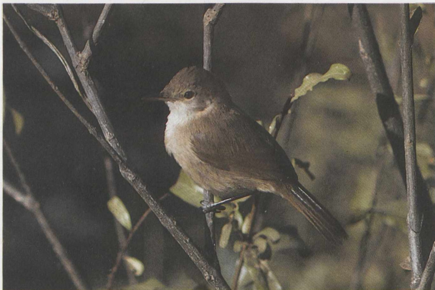
96 Cape Verde Cane Warbler Acrocephalus brevipennis , São Tiago, Cape Verde Islands, February 1986 (René Pop) 97 Iago Sparrow Passer iagoensis , male, São Nicolau, Cape Verde Islands, March 1986 (René Pop)