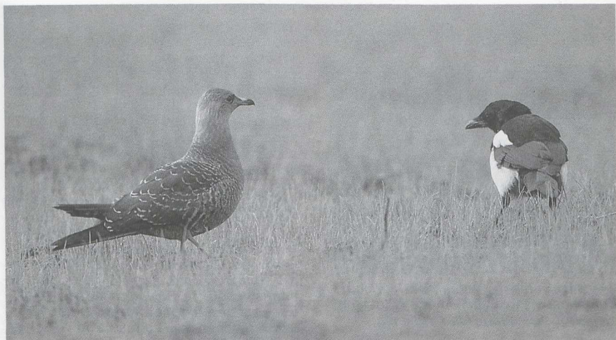
105 Kleinste Jager Stercorarius longicaudus en Ekster Pica pica , Wuustwezel, Antwerpen, september 1986

Woestijneplevier Charadrius leschenaultii werd op 23 juli bij Zeebrugge ontdekt. Dit betekende het derde geval voor België. Rond 10 augustus waren er enkele Morinelplevieren C. morinellus langs de Dodaarsweg Fl aanwezig. Op 4 september zaten er twee juvenielen te Kallo. Een leuke ontmoeting met deze soort had een bioloog in De Uithof U, die, op zijn knieën bezig in de proeftuin, opeens oog in oog met twee exemplaren zat. De enige Amerikaanse Gestreepte Strandloper Calidris melanotos werd op 31 augustus gemeld te Kallo. Op 23 september zou er een Siberische Gestreepte Strandloper C. acuminata gefotografeerd zijn op Texel Nh. Een 'stint' Calidris , die van 9 tot 12 augustus langs de Oostvaardersdijk zat, liet in plaats van een sluitende determinatie grote onenigheid onder de aanwezige vogelaars achter. Een adulte Breedbekstrandloper Limicola falcinellus die op 20 en 21 juli in de Ooypolder Gld zat, was mogelijk al vanaf 6 juli aanwezig. Behalve de Blonde Ruiters Tryngites subruficollis die op 4 juli bij Kallo zat, was er in België nog een geval in Het Zwin van 27 tot 30 juli. Vele 10-tallen vogelaars in Nederland waren daarom dolblij dat er van 16 tot 19 augustus één te bewonderen viel op een onder water gezet bollenveld bij Lisse Zh.