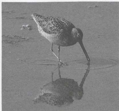
104 grijze snip Limnodromus griseus/scolopaceus , Flaauwers Inlagen, Zeeland, augustus 1986 (Alan Williams)

Terschelling, te Noordwijk Zh (drie) en te Wassenaar Zh (drie), op 15 augustus te Kallo Ovl, op 23 augustus één bij Kreileroord Nh, op 4 september één bij Aalten Gld en op 27 september twee langs de Knardijk. Op 5 augustus vlogen drie oievaarders Ciconia over Katwijk Zh en op 12 augustus 11 over de AW-duinen Nh. Op 5 september was er één bij Veenendaal U en op 13 september één in de Flevo. Op 12 september vlogen er niet minder dan 12 oievaarders over Middelburg Z en op 13 september waren er twee te Souburg Z. Voorpaginanieuws waren de 13 exemplaren die van 24 op 25 september overnachtten in het centrum van Turnhout A. De Zwarte Ibis Plegadis falcinellus bleef de gehele maand augustus te Schelle A tot hij op de 31ste te Blokkersdijk A overvliegend werd waargenomen. Daarna verbleef hij op 2 september te Willebroek A en op 5 september te Niel A. Wie is er een Heilige Ibis Threskiornis aethiopicus kwijt? Op 4 juli zat er een te Ellewoutsdijk Z. De gehele zomer verbleef een Kleine Zwaan Cygnus columbianus langs de Oostvaardersdijk Fl. Het mannetje Blauwvleugeltaling Anas discors van Blokkersdijk zat daar van 3 tot 9 juli en werd daarna nog éénmaal te Kallo-Doel Ovl waargenomen, waar de vogel ook eind juni was signaleerd. Ten minste twee Ijseenden Clangula hyemalis overzomerden op Terschelling. Op 5 september werden er reeds negen gezien bij