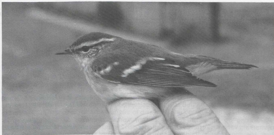
101 Bladkoninkje Phylloscopus inornatus , De Kennemerduinen, Noordholland, september 1985

Het vorige recordjaar in Nederland was 1967 met 37 Bladkoninkjes (Tekke 1968). Van 1973 tot en met 1985 zijn er 210 Bladkoninkjes in Nederland vastgesteld. Veruit de meeste (93%) werden in de periode van 24 september tot 28 oktober (week 39 tot 43) waargenomen.