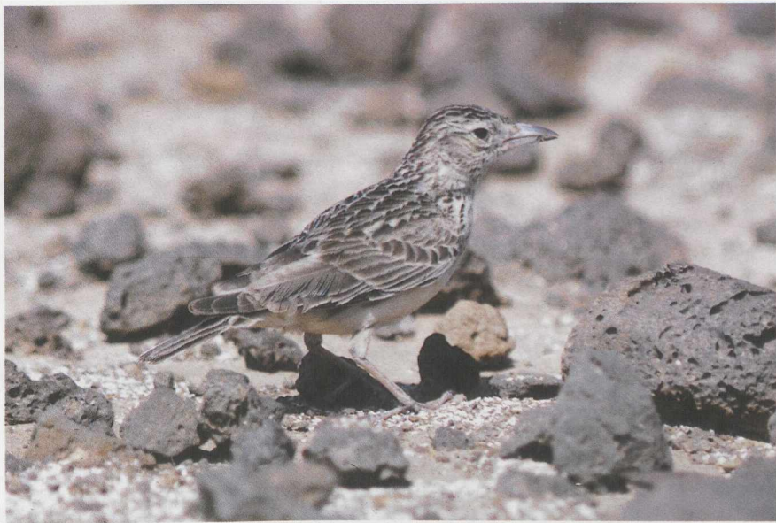
94-95 Razo Lark Alauda razae , male & female, Razo, Cape Verde Islands, March 1986