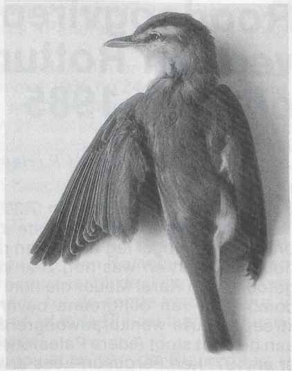
80 Rodoogvireo Vireo olivaceus , Alme-re, Flevoland, oktober 1985, dood gevonden te Wormerveer, Noordholland (Karel A Mauer)

NAAKTE DELEN Iris donkerbruin. Bovensnavel grijszwart met zeer smalle vleeskleurige snijrand, ondersnavel vleeskleurig, in