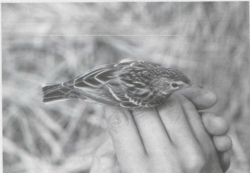
99-100 Pechora Pipit Anthus gustavi , Taiwan, October 1982 (Urban Olsson)