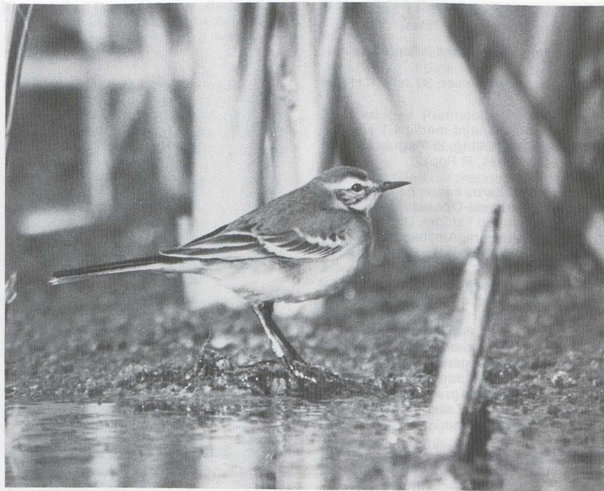
87 Citrine Wagtail Motacilla citreola , Castricum, Noordholland, September 1984 (Huub Huneker)