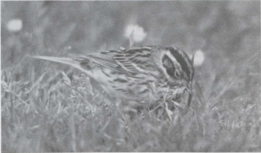
70 Dwerggors Emberiza pusilla , Terschelling, Friesland, mei 1985 (Pieter Bison).

Lombardsijde Wvl op 26 juni. Op 27 mei werd te Blankenberge een Orpheusspotvogel Hippolais polyglotta gevangen. Te Den Oever Nh verbleef op 10 juni een Grauwe Fitis Phylloscopus trochiloides ; de zanger liet zich nauwelijks zien maar zowel de zang als de roep konden worden opgenomen. Op 4 mei werd te Knokke een zingende Noordse Boszanger P borealis waargenomen. Op Schiermonnikoog zong van 15 tot 25 mei een Kleine Vliegenvanger Ficedula parva ; ook waren er waarnemingen te Vollenhove O (20 mei), Eemshaven (25 mei) en op de Maasvlakte (2 juni). Een vrouwtje Withalsvliegenvanger Falbicollis werd gevangen op de Maasvlakte op 10 mei; tot 12 mei liet de vogel zich daar observeren. Half mei werden in de Ooypolder zeven territoria ontdekt van Buidelmezen Remiz pendulinus . Er kon echter geen broedsucces worden vastgesteld; half juni waren alle nesten verlaten. Een succesvol broedgeval deed zich wel voor in Zuidelijk Fievoland alwaar op 9 juli uitgevlogen jongen werden waargenomen. Buidelmezen werden ook gemeld te Lier (28 april) en bij De Blocq van Kuffeler Fl (1 juni). Een Roodkopklauwier Lanius senator werd