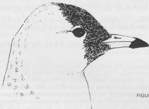
FIGURE 1 Common Gull Larus canus , France, May 1979.

Atypical Common Gulls In mid-May 1979, in northern Brittany, France, I observed a medium-sized gull with a dark face. At long range, I thought it was a first-summer Mediterranean Gull Larus melanocephalus . However, a closer look revealed that it was a first-summer Common Gull L. canus by its bill structure and coloration, head shape and wing pattern. Apparently, the dark face was the result of pigmentation and not of dirt, egg oil. Like the observation by Mauer (1984), this example shows that atypical Common Gulls might be mistaken for other gull species.