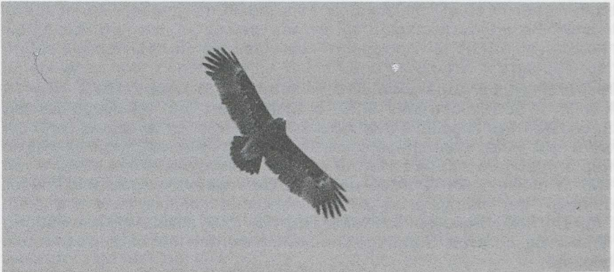
Mystery photograph 17. Solution in next issue.