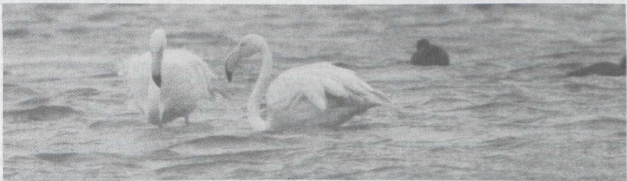
12 Flamingo's Phoenicopterus ruber roseus , Oostvoornse Meer, Zuidholland, januari 1985.

Voorkomen van Flamingo in Nederland Naar aanleiding van een waarneming van drie adulte Flamingo's Phoenicopterus ruber roseus in januari 1985 in en bij het Oostvoornse