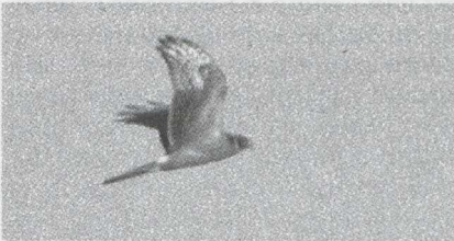
10 Steppekiekendief Circus macrourus . Bergen op Zoom, Noordbrabant, oktober 1984 (Edward J van IJzendoorn).

De kiekendief werd op 4 oktober door een 20-tal vogelaars gezien. Hij hield zich op in een vrij klein en overzichtelijk gebied, ongeveer een kilometer lang en 500 m breed, dat bestond uit verwaarloosd bouwland met aardhopen en riet. De vogel was veel en langdurig zichtbaar, meestal vliegend maar ook zittend op de grond. Verschillende malen vloog hij op minder dan 100 m voorbij en soms kon hij in de zit van deze afstand met de telescoop worden bekeken. De Steppekiekendief at enkele malen van een dode Houtduif Columba palumbus . Het stond niet vast dat hij deze zelf had geslagen. Wel werd gezien dat hij een Spreeuw Sturnus vulgaris sloeg. Op beide dagen was het zonnig. Op 3 oktober stond er een zwakke zuidoosten wind en op 4 oktober nam deze in de loop van de dag toe tot krachtig. Op die dag werd de Steppekiekendief na 13:00 niet meer gezien. Vermoedelijk was hij weggetrokken; er was vrij veel trek en er passeerden verscheidene andere roofvogels.