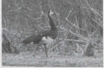
8-9 Spur-winged Goose Plectropterus gambensis , Morocco, June 1984.

GENERAL APPEARANCE & STRUCTURE Large, strongly built goose-like bird with broad wings and long legs and neck. Bare skin on forehead.