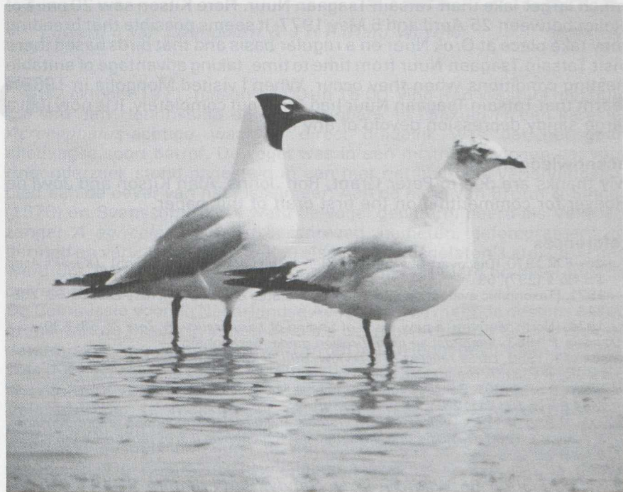
72 Relict Gulls Larus relictus in adult summer and first-summer plumage, Mongolia, June 1983 (J W de Roever).

In 1983, we stayed at Tatsain Tsagaan Nuur from 31 May tot 4 June. We visited the southern side of the lake where the nesting islands had been in 1982 but the islands had disappeared, apparently having been joined up to the lake shore by a further fall in the water-level. It would seem therefore that nesting at Tatsain Tsagaan Nuur is opportunistic and may only take place during years when conditions are suitable. Zubakin & Flint mentioned that breeding seems to be highly erratic, depending on availability of suitable islands and probably other factors. We saw a minimum of 10 Relict Gulls, all but one of which were adults in summer plumage. The other individual appeared to be in first-summer plumage which, according to Kitson, has not been described so far. The bird was associating with the adult Relict Gulls at the lake and its affinities were immediately obvious. It was very distinctive and should not be confused with a first-summer Mediterranean Gull (to see the two species together is geographically most unlikely). Adult Relict Gulls do bear a resemblance to second-summer Mediterranean Gulls due to the black subterminal marks on the primaries but differ from that species in a number of other