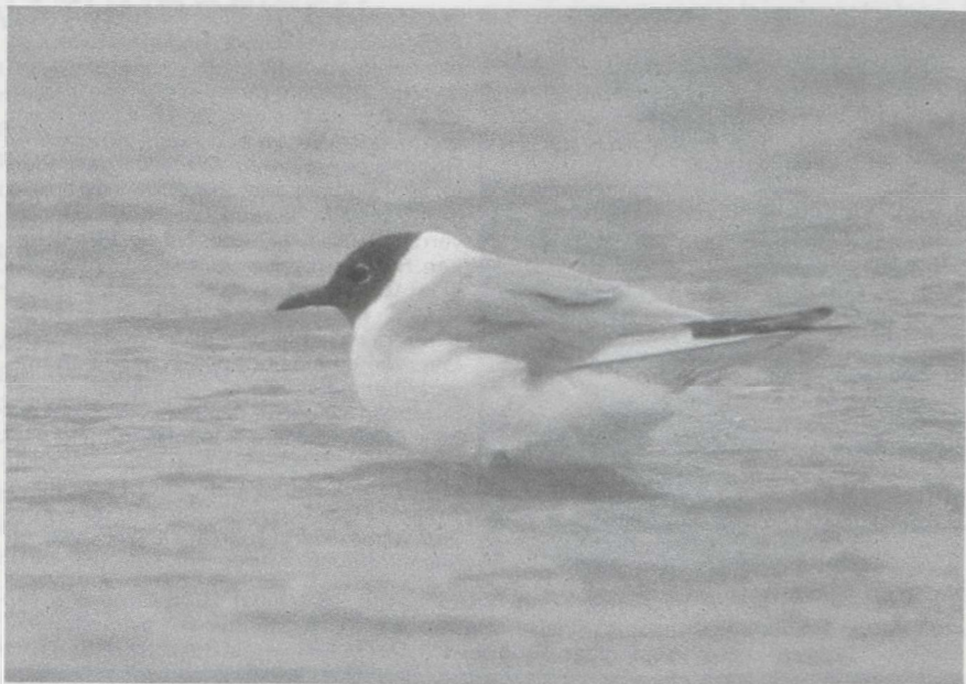
96 Kleine Kokmeeuw Larus philadelphia , IJmuiden, Noordholland, augustus 1985 ( Arie de Knijff ). 97 Witvleugelstern Chlidonias leucopterus en Zwarte Sterns C niger , Oostvaardersdijk, Zuidelijk Flevoland, augustus 1985 ( René van Rossum ).

Texel op 22 september. In de laatste week van september begon zich een ware invasie van Bladkoninkjes Phylloscopus inornatus af te tekenen. In deze periode werden er al meer dan 10 waargenomen. Van oostelijke herkomst was ook de Tjiftjaf P collybita tristis die werd gevangen in De Kennemerduinen op 30 september. Kleine Vliegenvangers Ficedula parva verschenen in de Eemshaven op 22 september, te Castricum op 25 september, te Westkapelle op 29 september en te Haarlem Nh op 30 september. Gedurende de gehele periode waren er enkele Buidelmezen Remiz pendulinus te vinden langs de Knardijk. Twee Buidelmezen werden gevangen te Lelystad op 17 augustus en een langstreckend exemplaar werd waargenomen te Den Oever. Op 15 september werd een juveniele Rose Spreeuw Sturnus roseus gemeld in de AW-duinen Nh. Dwerggorzen Emberiza pusilla werden gezien in de Eemshaven op 10 september en gevangen in de AW-duinen op 11 september en in De Kennemerduinen op 23 september.