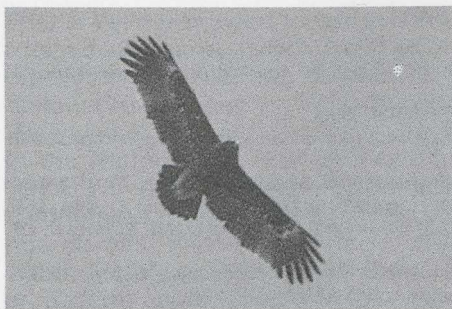
79 Spotted Eagle Aquila clanga , India, January 1979 (Klaus Malling Olsen).

judge. For separating Lesser Spotted and Spotted, it is therefore necessary to study their plumage.