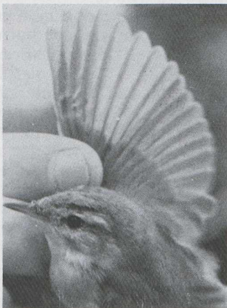
81 Veldrietzanger Acrocephalus agricola , Makkum, Friesland, oktober 1984.

BIOMETRIE Vleugellengte 56 mm; vleugel-formule p4 langste, p2 -5,25 mm (korter dan langste), p3 -0,25 mm, p5 -1 mm, p1 +2 mm langer dan langste handdekveer; p2 reikte tussen p7 en p8, dichter bij laatste; versmalling binnenvlag p2 minimaal 11 mm. Staartlengte 52 mm; staartafronding minimaal 8 mm. Snavellengte tot bevedering 9,7 mm, tot schedelbasis 15,5 mm. Gewicht 11 g (8:00). Alle maten bepaald volgens Perdeck & Speek (zonder datum).