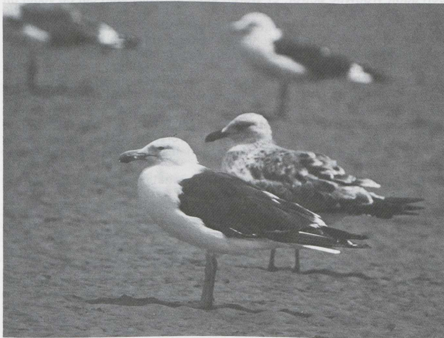
80 Kelp Gull Larus dominicanus , Kenya, January 1984.

Kelp Gull in Kenya in January 1984 On 2 January 1984, on the beach at Malindi, Kenya, Jef de Ridder photographed a large dark-backed gull. It was identified from the taken photograph as an adult Kelp Gull Larus dominicanus in summer plumage. The gull's most striking features were its thick bill with pronounced orange gonys, white head without any markings, small dark eye and greenish-yellow legs. The colour of the mantle was as dark as in nearby Lesser Black-backed Gulls L fuscus of subspecies L f fuscus . The following description is based on the colour transparency.