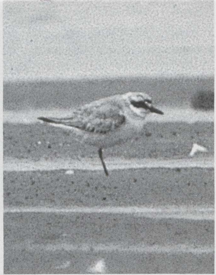
90 Steppevorkstaartplevier Glareola nordmanni , Castricum, Noordholland, augustus 1985 (Arnold Meijer). 91 Woestijnplevier Charadrius leschenaultii , Den Oever, Noordholland, augustus 1985 (René Pop). 92 Grauwe Franjepoot Phalaropus lobatus , IJmuiden, Noordholland, september 1985 (René van Rossum).