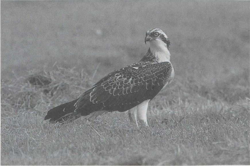
89 Visarend Pandion haliaetus , Petten, Noordholland, augustus 1985 (Hans Roersma).

manni werden geobserveerd te Deventer O op 19 augustus en te Castricum Nh van 22 tot 29 augustus. 10-tallen belangstellenden trokken naar de waddijk bij Den Oever Nh waar van 7 tot 30 augustus een Woestijnplevier Charadrius leschenaultii verbleef (of was het toch een Mongoolse Plevier C mongolus ?). Op de inmiddels traditionele verzamelplaats van Morinelplevieren C morinellus op de Maasvlakte Zh werden in de eerste week van september maar liefst 40 exemplaren geteld. Morinellen werden ook gezien te Westkapelle Z op 19 augustus en te Kalmthout op 25 augustus (twee). Amerikaanse Gestreepte Strandlopers Calidris melanotos verbleven in Zuidelijk Flevoland op 26 juli, in de Flauwers Inlaag Z van 26 juli tot 5 augustus en te Sint Kruis-Winkel Ovl van 5 tot 9 augustus. Poelruiters Tringa stagnatilis waren er te Kalmthout op 3 juli, bij Antwerpen in de eerste week van juli (drie), in Zuidelijk Flevoland op 17 juli en op 24 en 25 augustus, te Beerse van 21 tot 26 augustus en te Antwerpen op 15 september. De waarneming van een Terekruiter Xenus cinereus in de Oostvaardersplassen op 11 juli was de derde Nederlandse