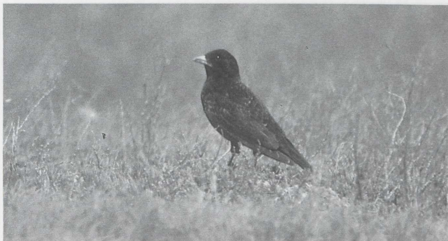
85 Zwarte Leeuwerik Melanocorypha yeltoniensis , mannetje, Kazachstan, juni 1985 (Huub Huneker).