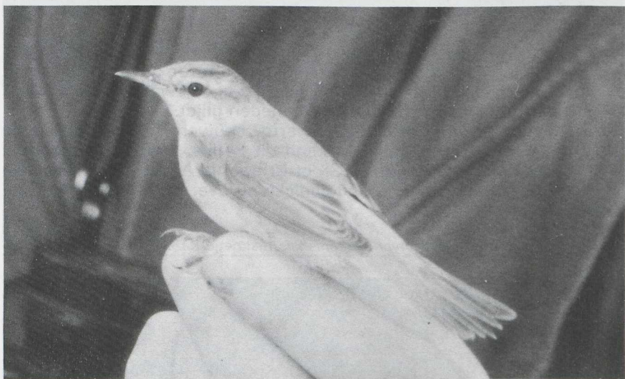
82-83 Velddrietzanger Acrocephalus agricola , Makkum, Friesland, oktober 1984.

Paddyfield Warbler Acrocephalus agricola was trapped, ringed and released at Makkum, Friesland. A description of the bird is given. It was the second record for the Netherlands, the first was in October 1971.