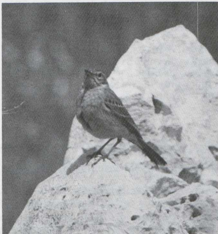
59-60 Langsnavelpieper Anthus similis , Israël, april 1984 (Peter de Knijff).

De Langsnavelpieper zou kunnen worden verward met de Duinpieper A campestris . De verschillen zijn samengevat in tabel 1. Wij vonden enkele verschillen die door Walsh & Wassink (1980) niet als zodanig werden beschouwd (maar wel in het redactionele naschrift), en vonden de wel door Walsh & Wassink genoemde verschillen moeilijker waarneembaar dan zij suggereren. De Langsnavelpiepers leken groter en dikbuikiger dan de in Israël voorkomende Duinpiepers. De snavel was lang en dik tot aan