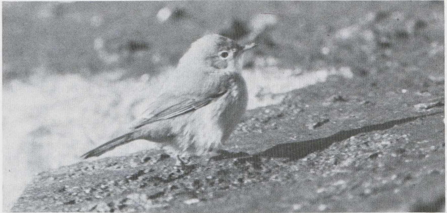
55 Brilgrasmus Sylvia conspicillata , IJmuiden, Noordholland, november 1984.

lichtbruin of, wanneer deze in de rui naar het eerste winterkleed is vernieuwd, voor een deel wit. Bij de meeste in Nederland verzamelde eerstejaars Grasmussen in het RMNH en ZMA was de buitenste pen lichtbruin.