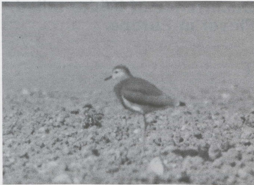
49 White-tailed Plover Chettusia leucura , GDR, May 1976 (K Hofmann).