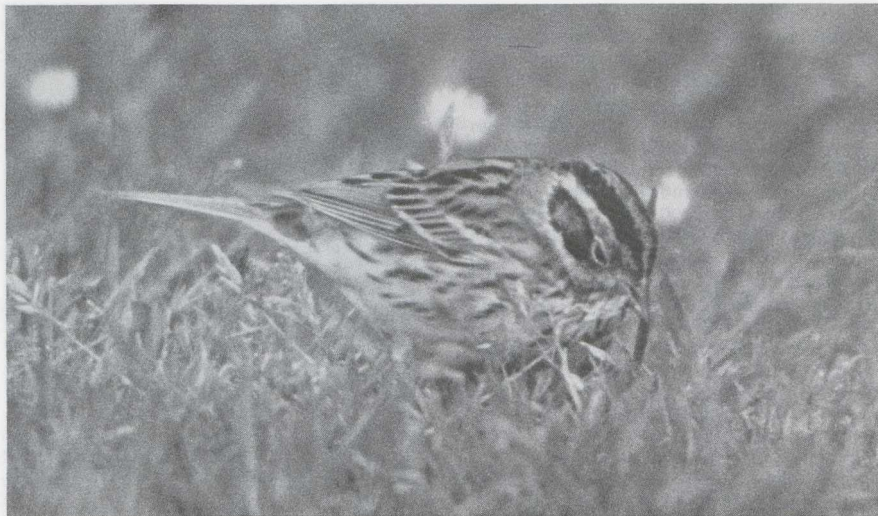
70 Dwerggors Emberiza pusilla , Terschelling, Friesland, mei 1985 (Pieter Bison).

Lombardsijde Wvl op 26 juni. Op 27 mei werd te Blankenberge een Orpheusspotvogel Hippolais polyglotta gevangen. Te Den Oever Nh verbleef op 10 juni een Grauwe Fitis Phylloscopus trochiloides ; de zanger liet zich nauwelijks zien maar zowel de zang als de roep konden worden opgenomen. Op 4 mei werd te Knokke een zingende Noordse Boszanger P borealis waargenomen. Op Schiermonnikoog zong van 15 tot 25 mei een Kleine Vliegenvanger Ficedula parva ; ook waren er waarnemingen te Vollenhove O (20 mei), Eemshaven (25 mei) en op de Maasvlakte (2 juni). Een vrouwtje Withalsvliegenvanger Falbicollis werd gevangen op de Maasvlakte op 10 mei; tot 12 mei liet de vogel zich daar observeren. Half mei werden in de Ooypolder zeven territoria ontdekt van Buidelmezen Remiz pendulinus . Er kon echter geen broedsucces worden vastgesteld; half juni waren alle nesten verlaten. Een succesvol broedgeval deed zich wel voor in Zuidelijk Fievoland alwaar op 9 juli uitgevlogen jongen werden waargenomen. Buidelmezen werden ook gemeld te Lier (28 april) en bij De Blocq van Kuffeler Fl (1 juni). Een Roodkopklauwier Lanius senator werd