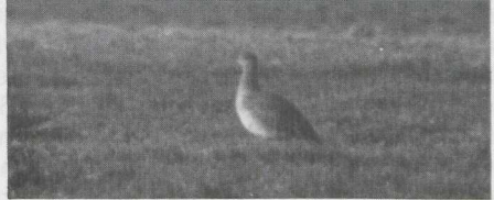
57-58 Kleine Trap Tetrax tetrax , Lage Zwaluwe, Noordbrabant, februari 1983.

veren wit. Overige dekveren bruin met zwarte en witte streepjes. Grote handdekveren zwart.