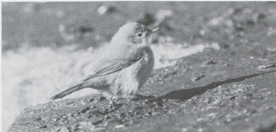
55 Brilgrasmus Sylvia conspicillata , IJmuiden, Noordholland, november 1984.

lichtbruin of, wanneer deze in de rui naar het eerste winterkleed is vernieuwd, voor een deel wit. Bij de meeste in Nederland verzamelde eerstejaars Grasmussen in het RMNH en ZMA was de buitenste pen lichtbruin.