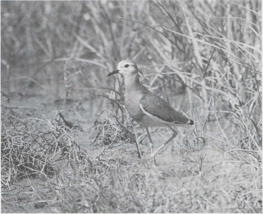
50 White-tailed Plover Chettusia leucura , Iraq, April 1965.

summer movements of Lapwings in Europe (Imboden 1974). Autumn migration of White-tailed does not start until August (Glutz von Blotzheim et al ). Unlike with Sociable Plover, the distribution of White-tailed records in Europe does not suggest any association with Lapwing movements (cf van den Berg 1984). White-tailed seems to associate much less with Lapwing than Sociable Plover, possibly due to different habitat preferences of the two species. In their regular range, some populations of White-tailed Plover are highly migratory and apparently somewhat nomadic which may be related to the exploitation of only temporarily flooded habitats.