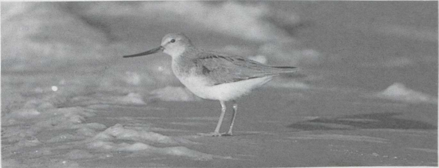
65 Terek Ruitert Xenus cinereus , Huizen, Noordholland, juni 1985 (Ger Blok).

28 mei zou in hetzelfde gebied ook een mannetje Kleinst Waterhoen P pusilla hebben geroepen. Op verschillende plaatsen werden in april en mei Kraanvogels Grus grus waargenomen. In de Oostvaardersplassen werd in mei enkele malen een Steltkluit Himantopus himantopus gezien. Grielen Burhinus oedichnemus verschenen te Vlaardingen Zh op 16 april en in de AW-duinen Nh op 21 april. Op de vlasakkers in Zuidelijk Flevoland waren in mei weer Morinelplevieren Charadrius morinellus te vinden; het hoogste aantal (43+) werd geteld op 19 mei. De Amerikaanse Gestreepte Strandloper Calidris melanotos lijkt een regelmatige verschijning te worden: er waren waarnemingen in