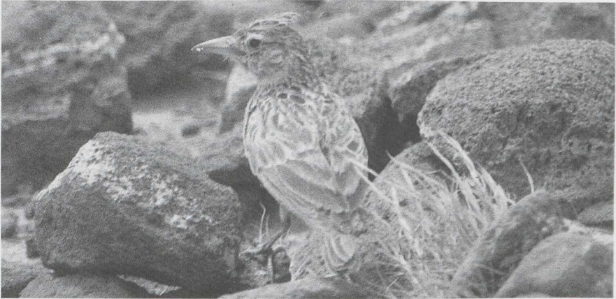
61-62 Razo Lark Alauda razae , male & female, Cape Verde Islands, March 1985 (A P van Harreveld).