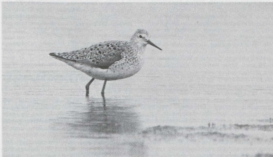
64 Poelruiter Tringa stagnatilis , Westzaan, Noordholland, mei 1985.

schijnlijk werden de jongen uitbroed in een knotwilg. Bijzonder waren ook de broedgevallen van twee paartjes Middelste Zaagbekken Mergus serrator in het Veerse Meer Z. Rosse Stekelstaarten Oxyura jamaicensis waren er te Kolhorn Nh en in Flevoland (twee) waar een mannetje gepaard was met een vrouwtje Tafeleend A ferina . In mei werd een dozijn Zwarte Wouwen Milvus migrans gemeld. Van 25 april tot 9 mei bevond zich een mannetje Steppekiekendief Circus macrourus op Schiermonnikoog Fr. Belangstellenden konden de spectaculaire baltsvluchten gadeslaan en zien hoe prooien werden overgedragen aan een vrouwtje Blauwe Kiekendief C cyaneus . Van een gemengd broedgeval is het echter toch niet gekomen. Op de Boschplaat van Terschelling overzomerde een Bastaardarend Aquila clanga ; de vogel arriveerde eind april en bleef tot in juni. Interessant is in dit verband de melding van een ongedetermineerde arend die op 24 april in noordwestelijke richting over Texel vloog. Op verschillende plaatsen werden in mei en juni Roodpootvalken Falco vespertinus gezien.