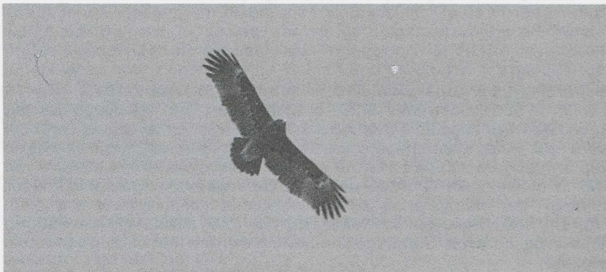
Mystery photograph 17. Solution in next issue.