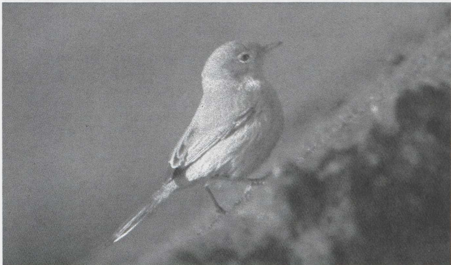
52 Brilgrasmus Sylvia conspicillata , IJmuiden, Noordholland, november 1984 (Edward J van IJzendoorn).

ONDERDELEN Lichtbruin, nauwelijks lichter dan bovendelen, scherp gescheiden van keel; zijborst en flank iets donkerder, buik en onderstaartdekveren iets lichter, zonder duidelijke overgangen.