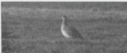
57-58 Kleine Trap Tetrax tetrax , Lage Zwaluwe, Noordbrabant, februari 1983.

veren wit. Overige dekveren bruin met zwarte en witte streepjes. Grote handdekveren zwart.