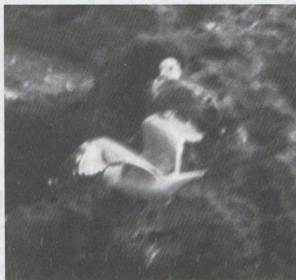
45-46 Ring-billed Gull Larus delawarensis in second alternate (= second summer) plumage, Morocco, April 1983 (Oran O'Sullivan).

SIZE Smaller than Yellow-legged Gull; presumably about size of Common Gull L canus (though no direct comparison). Bill stout and prominent. Leg longish.