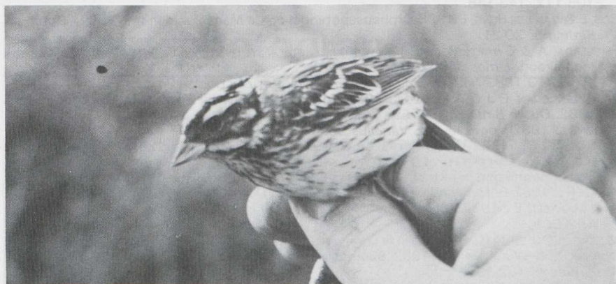
44 Yellow-browed Bunting Emberiza chrysophrys , Schiermonnikoog, Friesland, October 1982.