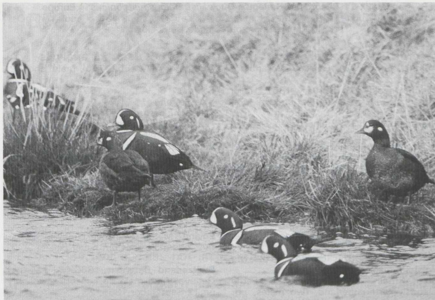
36 Harlequin Duck Histrionicus histrionicus , males and females in definitive alternate (= adult summer) plumage, Iceland, June 1978.