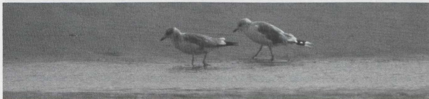
49 Stormmeeuw Larus canus in tweede basiskleed (= tweede winterkleed) en definitief basiskleed (= volwassen winterkleed), Schiermonnikoog, Friesland, augustus 1983.

Atypische Stormmeeuw op Schiermonnikoog in augustus 1983 Op 25 augustus 1983 zagen Ger Blok en Karel Mauer op het strand van Schiermonnikoog Fr een Stormmeeuw Larus canus die niet direct als zodanig werd herkend. Atypisch waren een donkere halve kopkap, ge-