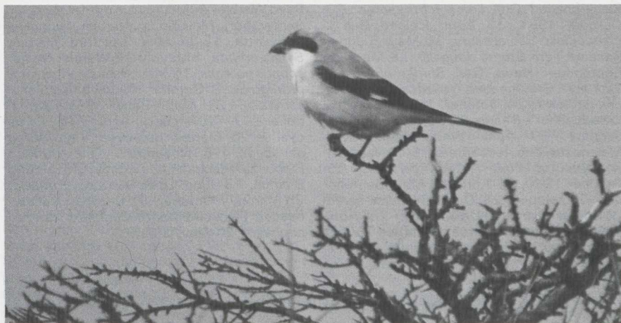
43 Lesser Grey Shrike Lanius minor , Terschelling, Friesland, September 1982.