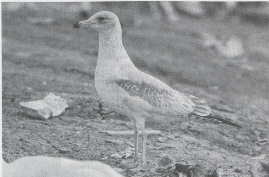
47 Ring-billed Gull Larus delawarensis in first basic (= first-winter) plumage, Texas, March 1982. 48 Common Gull L. canus in first basic plumage, Haarlem, Noordholland, winter 1971/72.