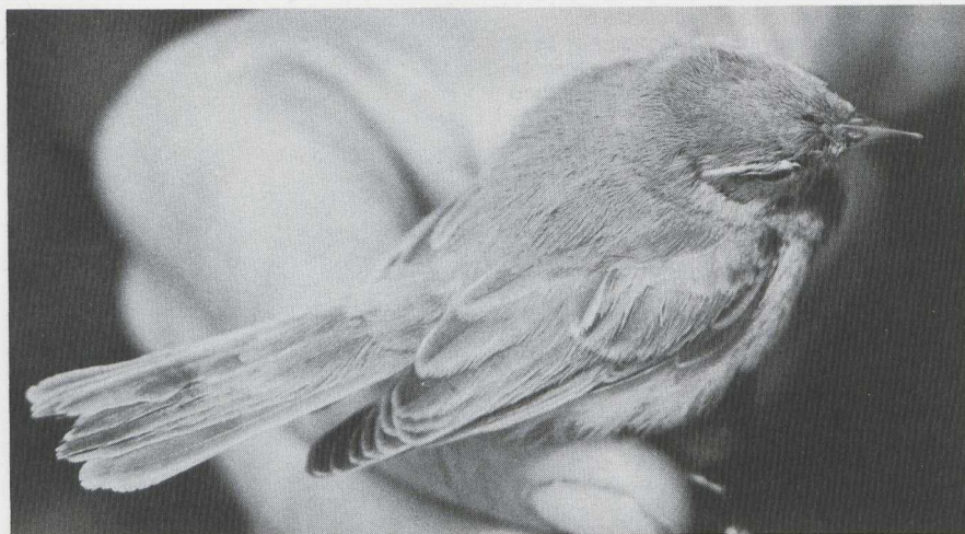
40 Booted Warbler Hippolais caligata , Terschelling, Friesland, October 1982 (Arnoud van den Berg).