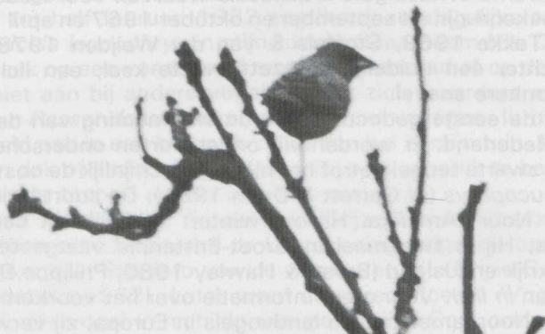
55 Indigo-gors Passerina cyanea , mannetje in definitief (= volwassen) kleed, Wieringermeer, Noordholland, juni 1983.