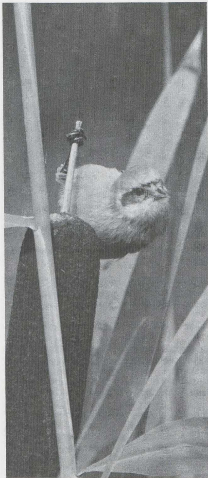
42 Penduline Tit Remiz pendulinus , moulting into definitive (= adult) plumage, Oostvaardersdijk, Flevoland, September 1982 (René Pop).

August, three, trapped (J A de Vries; de Jong 1982). Makkum, 11 September, trapped (J A de Vries; de Jong 1982). NOORDBRABANT Lierop, 24 August, trapped (M P van Aerle). NOORDHOLLAND Zandvoort, 7 August, trapped (H Vader).