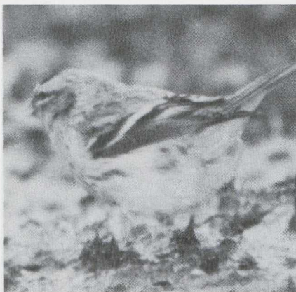
63 Witsluitbarmsijs Carduelis hornemanni , Vledder, Drenthe, januari 1984.

IJmuiden (10 maart), op de Kleine Afsluitdijk Nh (8 maart), te Lier (31 december tot 29 januari: twee), te Maasbracht L (18 en 27 januari) en te Walem A (2 januari). Bovendien zat er een vanaf maart op de Maasvlakte Zh. Er waren Kleine Burgemeesters L glaucoides in Amsterdam Nh (tot 7 januari), te Borsele Z (tot 8 februari), te Camperduin (tot 15 januari), te IJmuiden (14 januari tot 3 maart: mogelijk de vogel van Amsterdam), te Lauwersoog (tot 4 februari), te Oostende (6 januari) en op Terschelling Fr. Op 4 februari werd op het strand van Wijk aan Zee Nh een dood exemplaar gevonden. Interessant was de melding van een Kleine Burgemeester te Enschede O van 21 februari tot 9 maart. Er werden in januari en februari vrij veel Grote Burgemeesters L hyperboreus gezien. Leuk waren de waarnemingen in Amsterdam-Noord (19 januari: mogelijk de vogel van 16 december) en te Krommenie Nh (6 februari). Een mogelijke hybride Zilvermeeuw × Grote Burgemeester L argentatus × L hyperboreus werd op 19 februari te IJmuiden geobserveerd. Opmerkelijk was de waarneming van een in noordelijke richting vliegende Lachstern Gelochelidon nilotica op 30 maart op het REM-eiland. Dit zou het