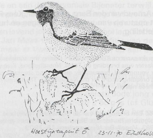
FIGUUR 1 Woestijntapuit Oenanthe deserti , mannetje, Eindhoven, Noordbrabant, november 1970 (Frank Neijts naar veldschets).

neming beëindigen, de vogel was op dat moment nog aanwezig. Nadat ik de literatuur had geraadpleegd, realiseerde ik me dat de vogel een mannetje Woestijntapuit O. deserti moest zijn geweest. Op 24 november en daarop volgende dagen kon de vogel niet meer worden teruggevonden.