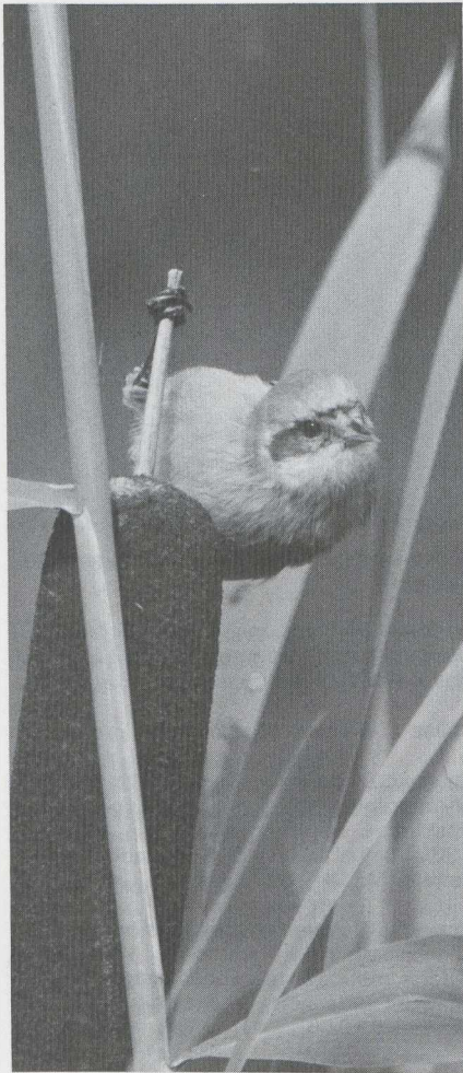
42 Penduline Tit Remiz pendulinus , moulting into definitive (= adult) plumage, Oostvaardersdijk, Flevoland, September 1982.

August, three, trapped (J A de Vries; de Jong 1982). Makkum, 11 September, trapped (J A de Vries; de Jong 1982). NOORDBRABANT Lierop, 24 August, trapped (M P van Aerle). NOORDHOLLAND Zandvoort, 7 August, trapped (H Vader).