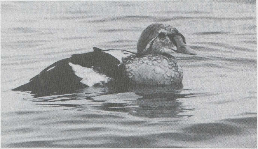
37 King Eider Somateria spectabilis , male in second basic (= second winter) plumage, IJmuiden, Noordholland, February 1982 ( Jan Mulder ).

Glossy Ibis Plegadis falcinellus 0,1 GRONINGEN Hoogkerk, 28-29 October (P G Schrijvershof, H J Wight et al ).