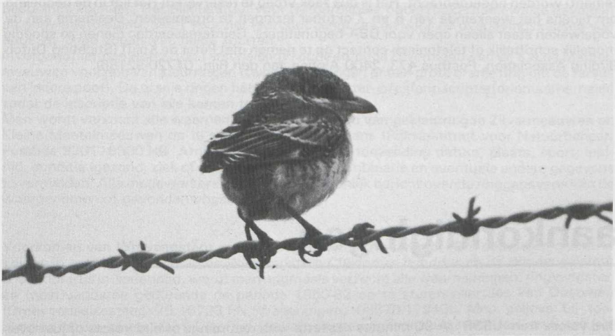
56 Roodkopklauwier Lanius senator in juveniel kleeed, Maasvlakte, Zuidholland, september 1983.

Juvenile Roodkopklauwier op Maasvlakte in september 1983 Op 24 september 1983 bevond zich op de Maasvlakte ZH een juvenile Roodkopklauwier Lanius senator . Hij onderscheidde zich van een juvenile Grauwe Klauwier L. collurio door de lichte buitenste schouderveren, lichte stuitvlek, lichte middelste dekveren en lichte vlek aan de basis van de handpennen. Het leek ons nuttig de aandacht te vestigen op deze waarneming aangezien in de periode 1975-82 alle door de Commissie Dwaalgasten Nederlandse Avifauna aanvaarde gevallen betrekking hadden op vogels in definitief (= volwassen) kleeed. Het gaat om 10 gevallen waarvan zeven uit mei en juni.