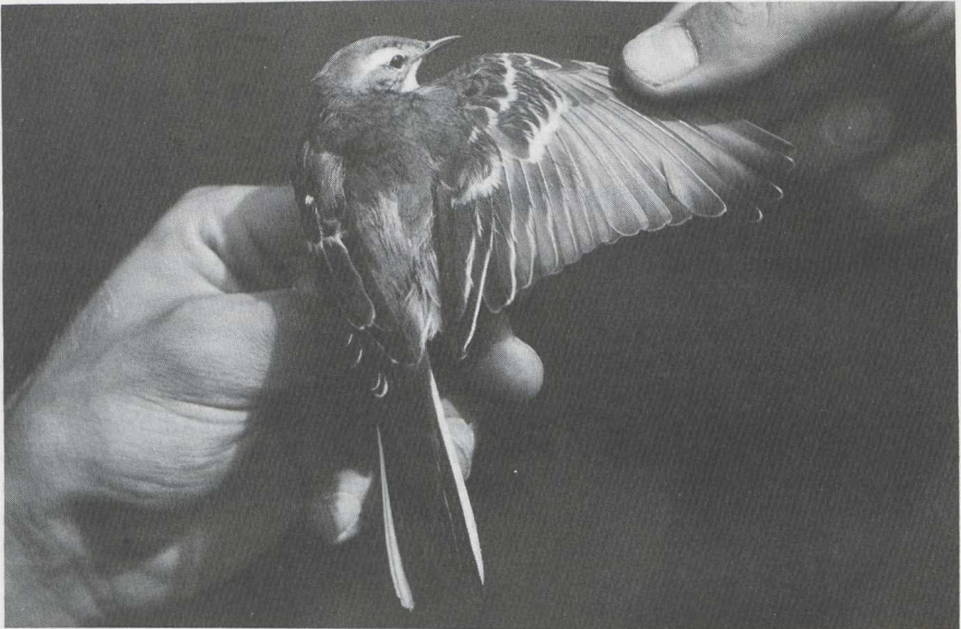
106 Citroenkwikstaart Motacilla citreola , Castricum, Noordholland, augustus 1984 (Hans Schekkerman).

BOVENDELEN Mantel en schouder donker zachtgrijs met bruine zweem. Rug en stuit donkergrijs zonder bruine zweem; langste stuitveren met duidelijke smalle zwarte top-randjes. Bovenstaartdekveren vrijwel egaal zwart.