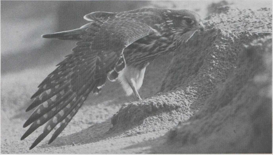
123 Smelleken Falco columbarius , Maasvlakte, Zuidholland, oktober 1984 (Arie de Knijff).

Klazienaveen D (10-15 juni) was. Amerikaanse Gestreepte Strandlopers Calidris melanotos waren er te Harlingen Fr (28 juli tot 2 augustus), in de Keersluisplas (19 augustus), te IJzendoorn Gld (9-11 september), op Vlieland Fr (18 september) en te Hoegaarden B (twee van 25 tot in ieder geval 29 september). Te Dudzele zou op 21 juli een Breedbekstrandloper Limicola falcinellus zijn gezien. Op 30 juli werd er een in de Lauwersmeer Gr geobserveerd. De Blonde Ruiter Tryngites subruficollis in defintief (= volwassen) kleeed die van 27 augustus tot 12 september te Dudzele verbleef, trok grote belangstelling. Dit was het eerste geval van deze strandloper voor België. Van 2 tot 4 september viel het verblijf van de Blonde Ruiter samen met dat van de Steppekieken-dief. Enkele vogelaars slaagden er bijna in ze samen in een kijkerbeeld te krijgen! Meldingen van Poelsnippen Gallinago media waren er te Overschie Zh (15 augustus), Terschelling (25 augustus), Lauwersoog Gr (5 september) en Dudzele (9 september). Poelruiters Tringa stagnatilis verbleven bij Antwerpen (twee van 17 tot 25 juli), te Eemshaven Gr (28 juli tot 1 augustus) en te Klazienaveen (29 juli). Er werden Kleinste Jagers Stercorarius longicaudus gezien te Dudzele (8 september) Huizen Nh (9 september) en Katwijk aan Zee Zh (10 september). Te Scheveningen werd op 10 en 29 sep-