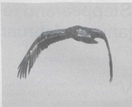
102 Steppearend Aquila rapax , Someren, Noordbrabant, januari 1984 (Jan Mulder).

blauwgrijs met zwarte punt; washuid en mondhoek heldergeel. Tenen heldergeel.