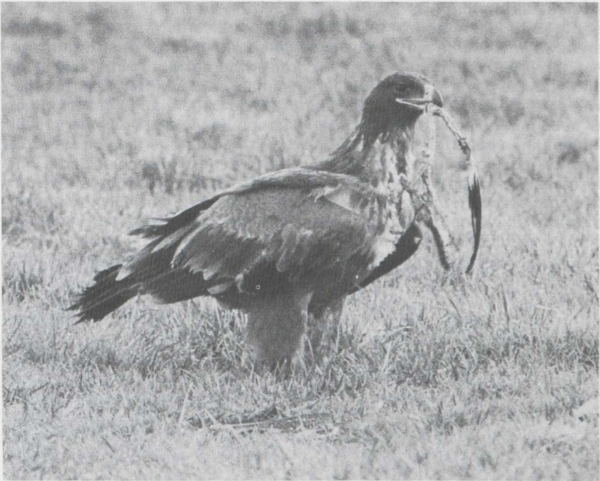
104 Steppearend Aquila rapax , Someren, Noordbrabant, januari 1984.

van de donkere bovenkop en nek en de egaal gekleurde onderdelen hoewel door regen nat en plakkerig geworden veren de onderdelen een gevlekte indruk konden geven. De grote snavel, de vorm van het neusgat, de ver naar achteren doorlopende mondhoek, de lichte basis van de handpennen, de vrij lichte middelste en kleine dekveren en onderdekveren en het lichte venster vormden aanvullende kenmerken welke pasten op een Steppearend en waarmee, al dan niet in combinatie met elkaar, andere soorten konden worden uitgesloten (cf Cramp & Simmons 1980, Porter et al 1981). Alleen de lichte stuit was niet precies in overeenstemming met hetgeen wordt vermeld voor een Steppearend en wees meer op een lichte Bastaardarend A clanga of jonge Keizerarend. Beide werden echter door de overige genoemde kenmerken uitgesloten. Gezien de kracht waarmee deze kenmerken voor Steppearend pleitten, werd aan de wat licht uitgevallen stuit niet al te veel betekenis toegekend.