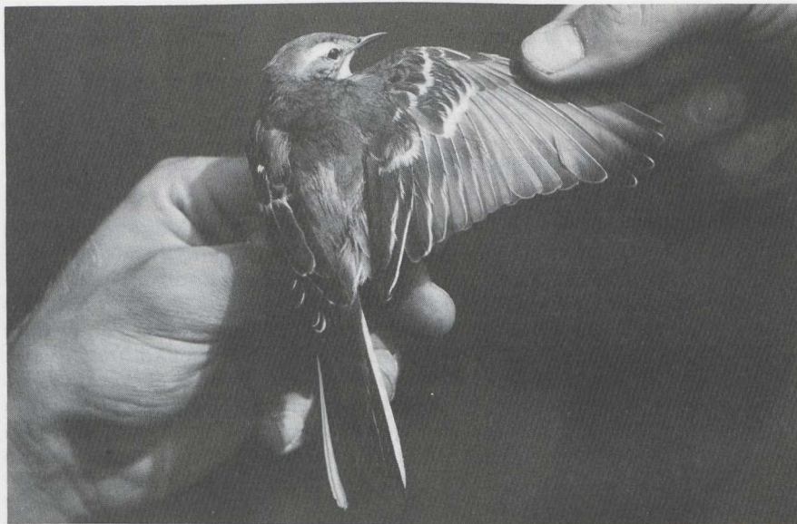
106 Citroenkwikstaart Motacilla citreola , Castricum, Noordholland, augustus 1984 (Hans Schekkerman).

BOVENDELEN Mantel en schouder donker zachtgrijs met bruine zweem. Rug en stuit donkergrijs zonder bruine zweem; langste stuitveren met duidelijke smalle zwarte top-randjes. Bovenstaartdekveren vrijwel egaal zwart.