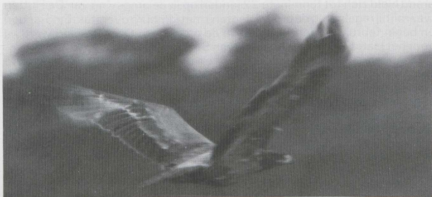
103 Steppearend Aquila rapax , Someren, Noordbrabant, januari 1984 (Jan Mulder).

VLUCHT Gewoonlijk laag. Zware, langzame vleugelslag af en toe onderbroken door glij-pauze. Tijdens glijden vleugels vrij bol door iets geheven arm en omlaag gebogen hand.