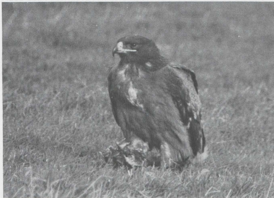
105 Steppearend Aquila rapax , Someren, Noordbrabant, januari 1984 (René Pop).

Op grond van structuur, verenkleed, geografische verspreiding en trekgedrag betrof het in dit geval zeer waarschijnlijk een Steppearend uit de nipalensis -groep en wel A r orientalis .