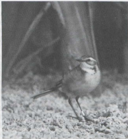
107-108 Citroenkwikstaart Motacilla citreola , Castricum, Noordholland, september 1984 (Huub Huneker).

GEDRAG Rustig foeragerend zonder sprintjes en sprongetjes, en vliegende insecten niet achtervolgend. In tegenstelling tot Witte Kwikstaart M. alba en Gele Kwikstaart gewoonlijk in dichte vegetatie vertoevend; na loslaten sluipend tussen lage braam- en kruipwilgbegroeiing foeragerend, later in dichte lisdoddevegetatie langs oever verblijvend en herhaaldelijk op drijvende velden darmwier foeragerend. Soms met staart kwikkend. Af en toe vleugels afhangend en kruin opzettend (vaak gevolgd door zich uitschudden en veren rangschikken).