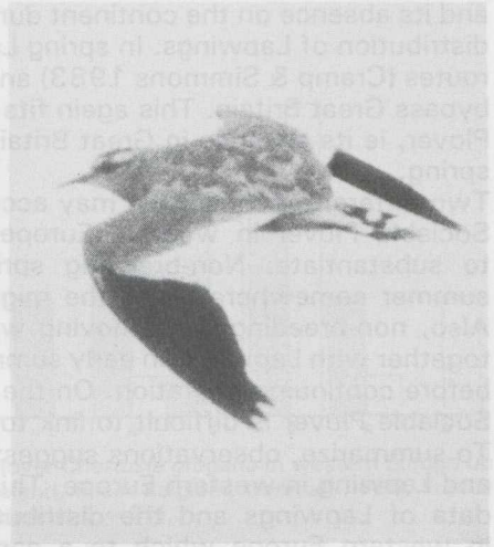
1-3 Sociable Plover Chettusia gregaria , Schiermonnikoog, Friesland, August 1982 (René Pop, Edward J van IJzendoorn, Jan Mulder).