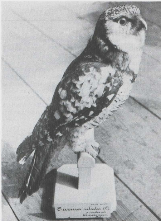
21 Sperweruil Surnia ulula , Rijksmuseum van Natuurlijke Historie, Leiden, Zuidholland, april 1983. Verzameld op 5 oktober 1920 te Amerongen, Utrecht.

maart een Sperweruil bij het vliegveld Münster-Osnabrück te Greven, Westfalen, op c 50 km van Enschede O. In België en Nederland werden tijdens de invasie geen Sperweruilen gemeld. De oorzaak van deze invasie was waarschijnlijk voedselschaarste. Rond Helsinki, Finland, vond ook van Oeraluil Strix uralensis en Laplanduil S nebulosa een invasie plaats (Lasse Laine in litt ).