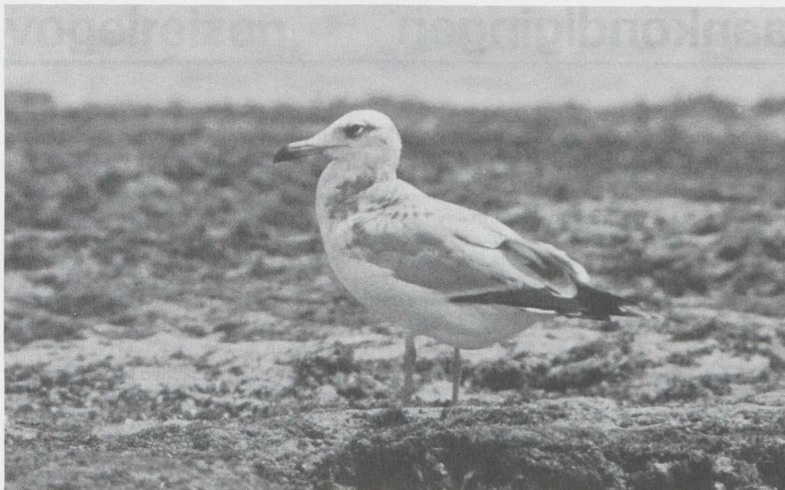
23 Reuzenzwartkopmeeuw Larus ichthyaetus in tweede basiskleed (= tweede winterkleed), Kenia, januari 1984 (Jan Mulder).

DBA-vogeldag op 4 februari 1984 te Antwerpen Op zaterdag 4 februari 1983 vond van 15:30 tot 21:00 te Antwerpen A de tweede door de stichting Dutch Birding Association georganiseerde vogeldag plaats. Er waren 100+ belangstellenden in het Rijks Universitair Centrum Antwerpen aanwezig. Het programma begon met een diaverslag van een vogelreis naar Mongolië en Siberië door Jowi de Roever. Daarna belichtte Arnoud van den Berg het voorkomen van de Duponts Leeuwerik Chersophilus duponti in Spanje. Ook ging hij in op de herkenning van deze geheimzinnige soort. Na de pauze volgde een lezing door Edward van IJzendoorn over de topografie van vogels. Vervolgens toonde Peter de Knijff een leerzame serie 'mystery birds' gevolgd door een bespreking van de kenmerken van de getoonde soorten. De dag werd besloten met een dialoog door Han Blankert over een aantal zeldzame en interessante vogels uit de afgelopen jaren uit België en Nederland.