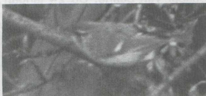
16 Bladkoninkje Phylloscopus inornatus , Hoogeveen, Drenthe, maart 1975 (E Bernardus).

VERENKLEED Vaalgroene kruinstreep; donkergroene laterale kruinstreep; dunne donkere oogstreep; vuilwitte wenkbrauwstreep, vooral duidelijk achter het oog; wangen donker gevlekt; keel wit. Nek donkergroen; mantel en rug vaalgroen. Borst, buik en flanken vuilwit. Tertiairs met duidelijke vuilwitte randen; een brede vleugelstreep gevormd door vuilwitte randen op de toppen van de grote vleugeldekveren. Staartpenne donker met laterale vuilwitte randen.