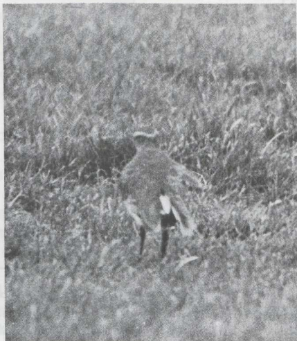
5 Sociable Plover Chettusia gregaria in definitive alternate (= adult summer) plumage, Langerbrugge, Oostvlaanderen, April 1962 (Willy Suetens). 6-7 Sociable Plover in first basic (= first winter) plumage, Engelum, Friesland, November 1981 (Frans Hoogland).