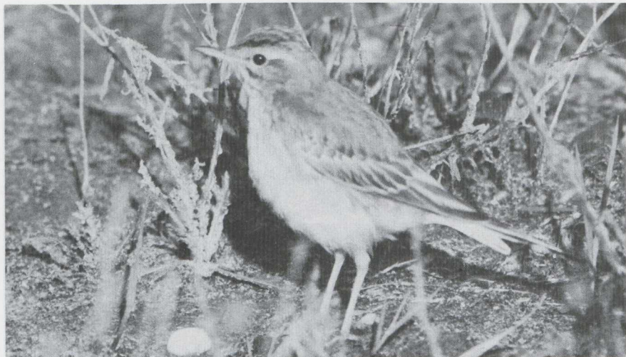
13 Duinpieper Anthus campestris , waarschijnlijk in eerste basiskleed (= eerste winterkleed), Amsterdam, Noordholland, december 1983.

Voor zover bekend was dit het eerste decembergeval van de Duinpieper voor Nederland en mogelijk voor westelijk Europa. Het laatste geval voor Nederland was tot nu toe op 1 november 1968 te Renkum Gld (van den Bergh et al 1979).