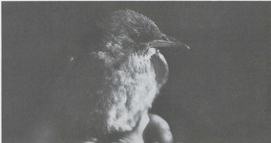
34 Rose Spreeuw Sturnus roseus in juveniel kleed, Vlieland, Friesland, september 1983.

november werd een Cetti's Zanger Cettia cetti gehoord te Ploegsteert Wvl. Drie Waaierstaartrietzangers Cisticola juncidis werden waargenomen op 22 oktober en 5 en 12 november te Antwerpen-Blokkersdijk A. Op 10 oktober zat er een Sperwergasmus Sylvia nisoria in Alkmaar Nh en op 30 oktober werd er een gevangen te Wasse naar Zh. Er waren drie gevallen van de Pallas' Boszanger Phylloscopus proregulus : een waarneming te Scheveningen Zh op 2 oktober en vangsten op Ameland Fr en te Haskerhorne Fr op 29 oktober. Ongeveer 10 Bladkoninkjes P inornatus werden gemeld. Zo waren er vogels op Ameland, te Castricum (vangst op 21 oktober), op de Maasvlakte, te Oostvoorne Zh (vangst op 21 oktober) en op Terschelling (minstens drie exemplaren van 7 tot 14 oktober en een vangst op 15 oktober). Opmerkelijk was de vangst van een Bladkoninkje te Loosdrecht U op 9 oktober. Kleine Vliegenvangers Ficedula parva verschenen op Ameland op 8 (twee vangsten) en 18 oktober (vangst), op de Maasvlakte op 29 oktober en op Terschelling van 11 tot 15 oktober. Twee Taigaboomkruipers Certhia familiaris werden gevangen: op 5 okto-