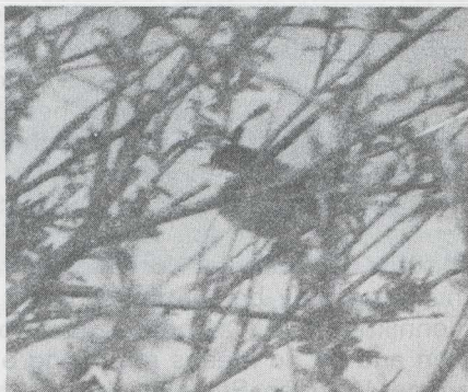
14-15 Kleine Zwartkop Sylvia melanocephala , mannetje in definitief (= volwassen) kleed, Eemshaven, Groningen, mei 1983 (Arnoud B van den Berg).

VERENKLEED Bovenkop en oorstreek gitzwart; kin en keel scherp begrensd grauw-wit. Mantel, schouders, rug en stuit egaal lichtgrijs. Borst grauwwit, naar onderen toe geleidelijk grijzer wordend; flanken grijs als bovendelen. Vleugel grijs met lichte randen