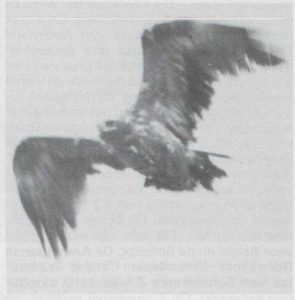
26 Steppearend Aquila rapax in predefinitief (= onvolwassen) kleeed, Zeven Heerlijkheden Heide bij Postel, Antwerpen, december 1983.

december bij de Clauscentrale NL, vanaf 23 november bij Delfzijl, op 5-6 november bij Katwijk aan Zee Zh, op 10 november te Knokke, van 17 december tot 26 januari in de E10-putten te Meer-Minderhout A en op 25 september te Ter-Wisch Gr. De waarneming van een Zwarte Wouw Milvus migrans op 8 november te Beerse A was laat. Op 12 november werd een Zeearend Haliaeetus albicilla gezien op vier verschillende plaatsen langs de kust: bij Castricum Nh, in de Kennemer- en AW-duinen Nh en bij Katwijk aan Zee. Bovendien waren er exemplaren op 1 oktober op Terschelling Fr, op 13 november in Flevoland, rond half november in de Millingerwaard Gld, op 19 november op Vlieland Fr, op 7-10 december in de Wieringermeer Nh en op Wieringen, op 17 en 21 december in het Lauwersmeergebied, op 22 december in Het Zwin Wvl, op 28 december te Delfzijl en in eind december weer op Terschelling (twee). Een Steppearend Aquila rapax (= A nipalensis ) pleisterde van 14 tot 27 december op de Zeven Heerlijkheden Heide bij Postel A. Dit was het eerste geval voor België en het tweede voor de Benelux. Te Zedelgem Wvl werd op 7 november een juveniele Steenarend Aquila chrysaetos gemeld. Op 1-7 oktober zat er een Roodpootvalk Falco vespertinus in Het Zwin.