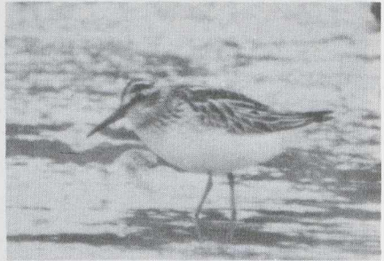
98 Breedbekstrandloper Limicola falcinellus in juveniel kleed, Serooskerke, Zeeland, augustus 1983.

De waarnemingen van twee verschillende Reuzensterns op Texel op 25 augustus waren het derde en vierde geval voor dit waddeneiland. Maximaal zes Witvleugelsterns Chlidonia leucopterus verbleven in Flevoland. Andere werden waargenomen op het Balgzand in augustus en september (minstens twee), op Marken Nh op 12 augustus (zes), bij Den Oever op 6 en 20 augustus en te Serooskerke in de derde week van augustus.