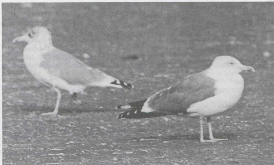
12 Yellow-legged Gull Larus cacchinnans in definitive basic (= adult winter) plumage (right) and Herring Gull L. argentatus (left), IJmuiden, Noordholland, october 1982 (Arnoud B van den Berg).

There were no Herring Gulls of the subspecies L. a. argentatus in definitive (= adult) plumage present for comparison. This subspecies is a common winter visitor to the Netherlands from at least early december onwards ( pers obs ). L. a. argentatus of the more northern parts of its range can be distinguished from L. a. argentatus in definitive plumage by the slightly larger size and the darker grey of the upperparts (about as grey as in Common Gull). Yellow-legged Gull in definitive plumage can be distinguished from northern L. a. argentatus with yellow or yellowish legs by the reduced dusky basic (= winter) streaking on head and neck, generally more black and less white on the primaries, the red orbital ring, and the richer coloured bill and legs. Yellow-legged has on the average a greater projection of the closed wing-tips beyond the tail and longer legs than Herring. Vocally, it is more similar to Lesser Black-backed than Herring Gull.