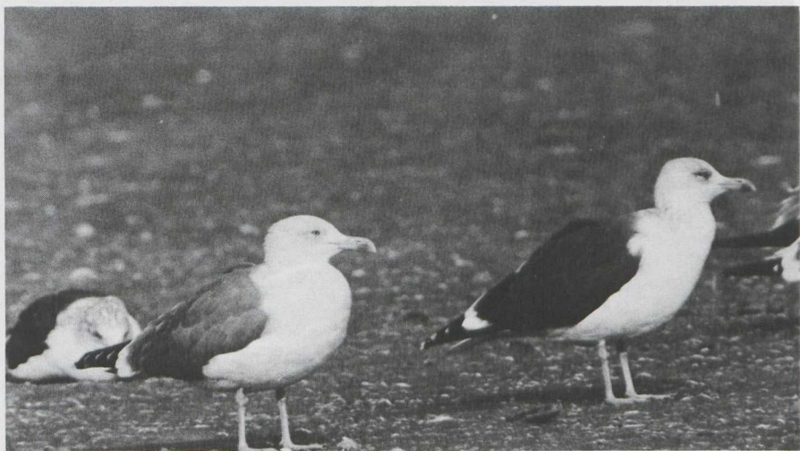
9 Yellow-legged Gull Larus cachinnans in definitive basic (= adult winter) plumage (middle) and two Lesser Black-backed Gulls L fuscus (left rear and right), IJmuiden, Noordholland, october 1982.

On 29 october 1982 I studied and photographed a Yellow-legged Gull of the subspecies L c michahellis in definitive basic (= adult winter) plumage at IJmuiden, Noordholland. It was standing on the beach next to Lesser Black-backed L fuscus of the subspecies L f graellsii and Herring Gulls L argentatus of the subspecies L a argenteus in definitive basic plumage. The bird was only slightly larger than both Lesser Black-backed and Herring. The grey of the upperparts was intermediate between that of Lesser Black-backed and Herring and similar to that of Common Gull L canus (of the subspecies L c canus ) in definitive basic plumage. There was more black on the outer six primaries than in Herring. Unlike Lesser Black-backed and Herring in definitive basic plumage, it had hardly any dusky streaking on head and neck. The impression of having a smaller eye than both Lesser Black-backed and Herring was due to the lack of dusky feathering around the eye and to the thicker appearance of the neck. The pale grey-yellow iris was less yellow than in Lesser Black-backed and Herring. The red orbital ring was similar to that of Lesser Black-backed. The bill looked slightly heavier with the tip of the upper mandible more curved vertically downwards. Both bill and legs were paler yellow than in Lesser Black-backed; the bill was richer coloured than in Herring.