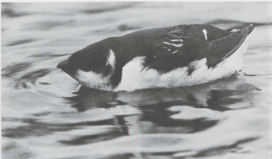
20 Kleine Alk Alle alle , Amsterdam-West, Noordholland, januari 1983 ( Jan Mulder ). 21 Bladkoninkje Phylloscopus inornatus , Delftse Hout, Zuidholland, februari 1983 ( René van Rossum ).