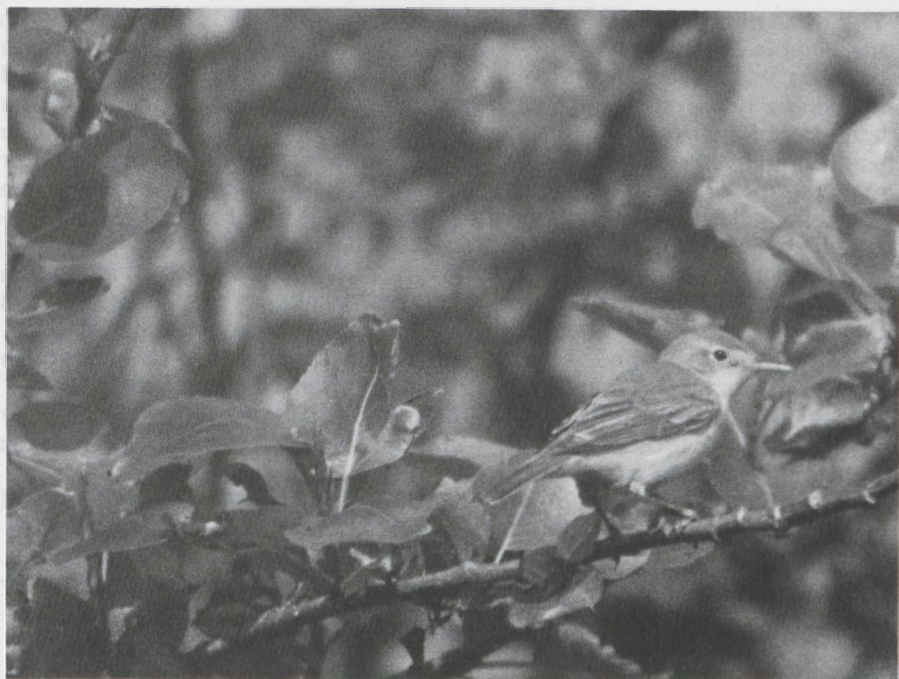
13 Orpheusspotvogel Hippolais polyglotta , De Maasvlakte, Zuidholland, mei 1982.

SCHARRINGA, C J G & OSIECK, E R 1981ab Zeldzame vogels in Nederland in 1979 & 1980. Limosa 54: 17-28; 127-136.