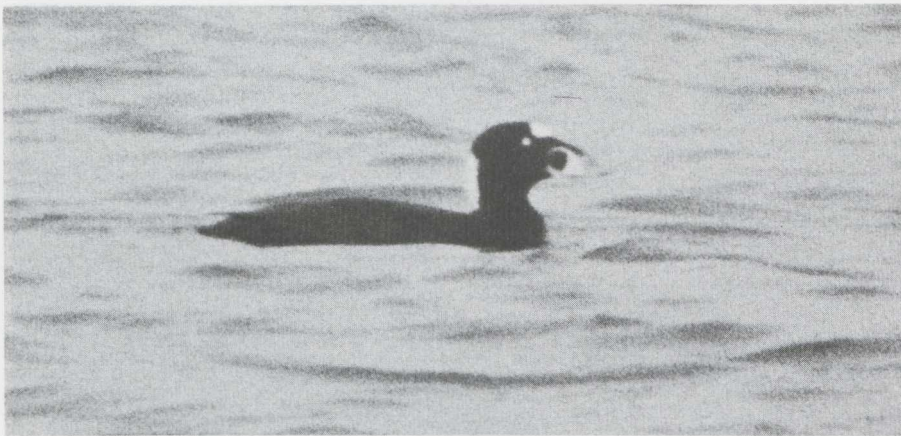
8 Surf Scoter Melanitta perspicillata , male in definitive alternate (= adult summer) plumage, Eemshaven, Groningen, november 1982.

60 m of us, proclaimed its identity without any doubt: it was an adult drake Surf Scoter Melanitta perspicillata . We watched the bird on and off for some hours. No white was visible on the wings; they were opened on one occasion. It seemed in excellent condition, showing no sign of oiling, and was frequently seen to dive. The bird stayed until 3 december (the photograph reproduced here was taken on 27 november).