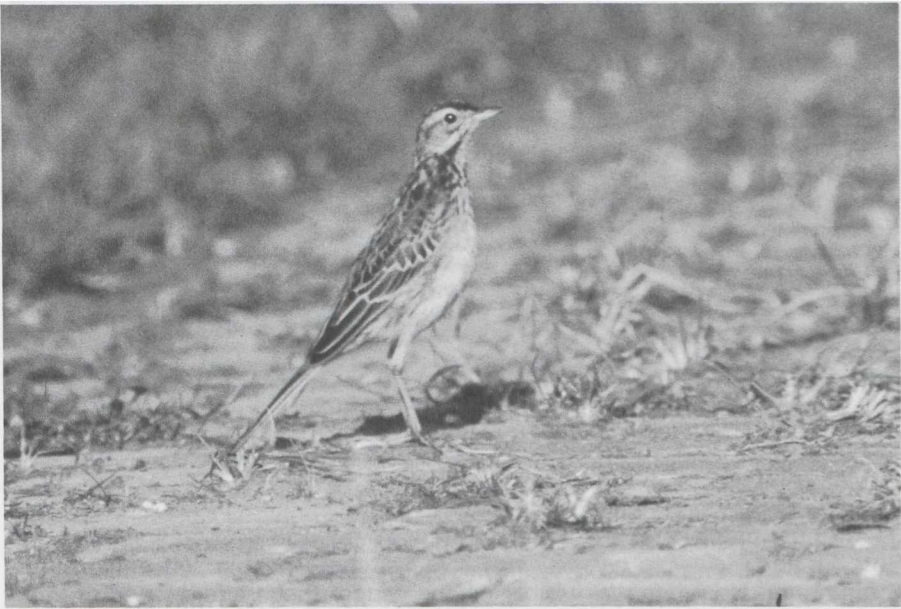
7 Mystery photograph 11. Solution in next issue.