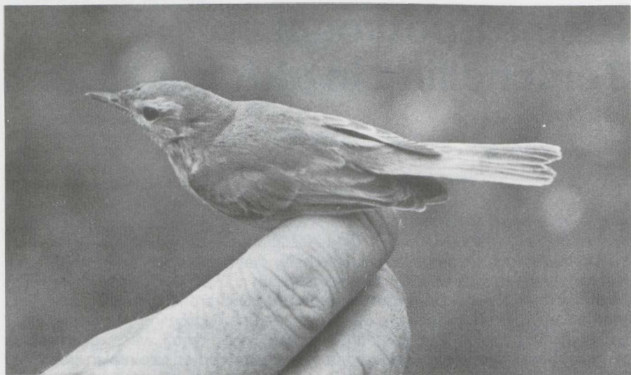
1-2 Kleine Spotvogel Hippolais caligata , Terschelling, Friesland, oktober 1982 (René Pop).