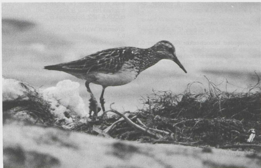
4 Pectoral Sandpiper Calidris melanotos in alternate (= summer) plumage, Huizen, Noordholland, august 1981 ( C J Breek ).

Iceland Gull Larus glaucooides 1,4 NOORDHOLLAND Camperduin, 19 april, bird in first basic (= first-winter) plumage (J Apperloo, P Bison, N F van der Ham). IJmuiden, 17 january to 5 march, bird in second or third basic (= second- or third-winter) plumage, photographed (van IJzendoorn & Oreel 1981). IJmuiden, 24 february, bird in first basic (= first-winter) plumage, photographed (van IJzendoorn & Mulder 1981). ZUIDHOLLAND De Maasvlakte, 12 december, bird in first basic (= first-winter) plumage (J Palm, R Schenk, P G Schrijvershof).