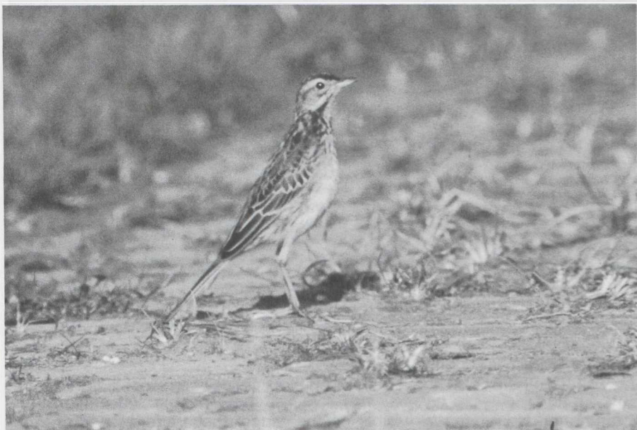
7 Mystery photograph 11. Solution in next issue.