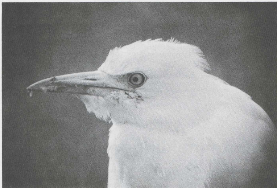
16 Koereiger Bubulcus ibis , Oene, Gelderland, februari 1983 (J W de Roever).

DUIKERS TOT IBISSEN IJsduikers Gavia immer werden waargenomen langs de Houtribdijk (2 januari) en op het Oostvoornse Meer Zh (22 januari). Op De Maasvlakte Zh verbleef de gehele periode een Kuifaalscholver Phalacrocorax aristotelis . Andere verschenen bij de Stevinsluizen Nh (22 januari) en te Oostende Wvl (11 februari). De Koereiger Bubulcus ibis van Oene Gld was de gehele periode aanwezig; hij liet zich voeren en werd bijzonder tam. Er verbleven Grote Zilverreigers Egretta alba bij Piaam Fr (twee) en in het Oostvaardersplassen-gebied Fl (twee); op 19 maart zat er bovendien een bij Zalk O. Een ongewoon grote groep van 34 Ooievaars Ciconia ciconia vloog boven Alblasserdam Zh op 7 maart. Er trokken op 12 maart vier over Spaarwoude Nh.