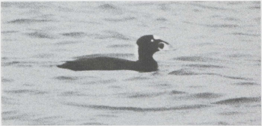
8 Surf Scoter Melanitta perspicillata , male in definitive alternate (= adult summer) plumage, Eemshaven, Groningen, november 1982 (Richard Vaughan).

60 m of us, proclaimed its identity without any doubt: it was an adult drake Surf Scoter Melanitta perspicillata . We watched the bird on and off for some hours. No white was visible on the wings; they were opened on one occasion. It seemed in excellent condition, showing no sign of oiling, and was frequently seen to dive. The bird stayed until 3 december (the photograph reproduced here was taken on 27 november).